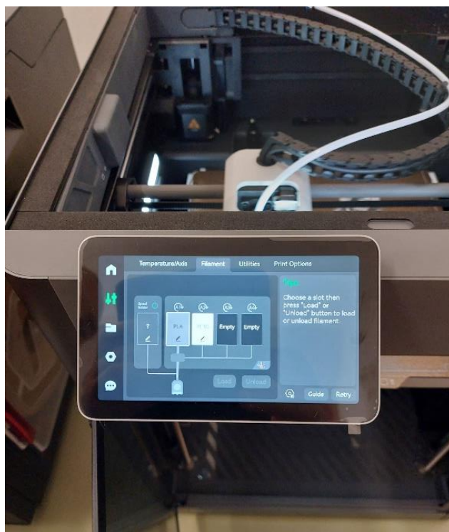
2. számú ábra. Nyomtatás különböző alapanyagokkal.

Nem meglepő, hogy a 3D nyomtatási technológiát a különböző ipari szereplők és a védelmi szféra (pl. rendőrség, honvédség 28 ) mellett egyre többen és egyre szélesebb körben alkalmazzák, mivel a folyamatos fejlesztések eredményeként további előnyök érhetők el.