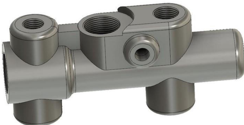
3. számú ábra. Munkahenger készítése 3D nyomtatással.

A 3D gyártási eljárás már jelenleg is számos lehetőséget kínál egyes logisztikai feladatok hatékonyabb és gyorsabb végrehajtására, mint pl. a haditechnikai alkatrészellátási problémák megoldása, a hatékonyság növelése vagy a logisztikai ellátási problémák kezelése és minimalizálása. A fejlesztési folyamat során helyben és azonnal ki lehet nyomtatni a prototípusokat (3. sz. ábra), akár különböző alapanyagok felhasználásával, amely lehetővé teszi a gyorsabb tesztelést és szükség esetén a módosítást.