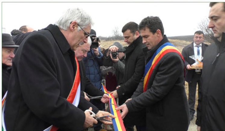
A mostani ideiglenes határnyitással elindult valami, ami mind a két országnak előnyt jelent