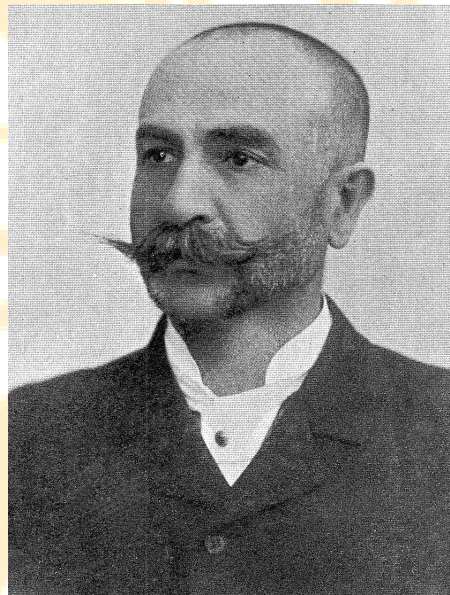
I. ábra. MÁRTONFI Lajos arcképe

MÁRTONFI Lajos ( I. ábra ) 1857. május 21-én született Szilágysomlyón, egy tehetős örmény család fiaként. Elemi iskolai tanulmányait szülővárosában, a gimnázium alsó tagozatát a zilahi, a felsőt a kolozsvári Református Főgimnáziumban végezte 1876-ban [2]. Ezt követően, a Kolozsvári Tudományegyetem hallgatója lett. Tanárai közt találjuk KANITZ Ágost, FABINYI Rudolf, ENTZ Géza és KOCH Antal nevét. Főleg az utóbbi kettő volt nagy hatással a már középiskolában a természettudományok iránt elkötelezett ifjú MÁRTONFIRA. Ez a hatás érződik egész későbbi tudományos munkásságán. Mégis, egyes életrajzírók állítása szerint, BRASSAI Sámuel tanácsára kezdett el foglalkozni a foraminiferák őslénytanával [7]. Ezt nem látjuk bizonyítottnak, sőt valószínűnek sem, hiszen nemcsak diákkorában, hanem egész élete folyamán rendkívül jó és szoros kapcsolatban állt KOCH Antallal, aki végig támogatta, kölcsönösen látogatták egymást. 1878/79-ben gyakornokként dolgozott KOCH Antal mellett [11]. Utóbb, az Erdélyi Múzeum-Egyesület kötelékében, a nyári szünidőkre, kutatói munkát biztosított számára. Még akkor is, amikor a mester már a Budapesti Pázmány Péter Tudomány-egyetemre távozott, a szamosújvári artézi kút ügyében, az egykori tanítvány hozzá folyamodott, s KOCH le is utazott az örmény metropoliszba, szakértői véleményt mondani a kérdésben [19]. Ugyanakkor, a BRASSAIVAL állítólagosan fenntartott kapcsolatának egyéb nyomát nem találni.