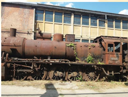
2. kép. Rozsdatemető