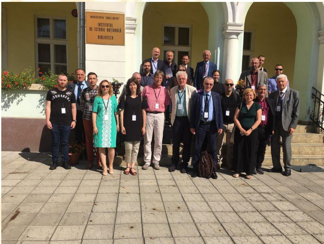
3. kép. A konferencia résztvevői