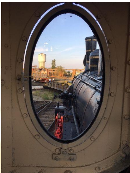
1.kép. Már nem fűtül a mozdony

Péntek délutánra „üzemlátogatás” szerepelt az előzetes programban. Elsőnek a kolozsvári vasúti gördülőanyagot javító és gyártó Remarul Február 16 vállalatot látogatták meg a konferencia résztvevői. A vállalat a kincses város egykor nagy tekintélynek örvendő ipari múltjának egyik ritka túlélője. 1870-ben alapították, egyidőben a Nagyvárad–Kolozsvár–Brassó vasútvonal építésével. 90 alkalmazottal indult, hogy az 1970-es évekre elérje tevékenysége csúcspontját. Ekkor 2700 dolgozót foglalkoztatott. Az ezredforduló környékén a visszaesett vasúti közlekedés a csőd szélére sodorta a céget. Jelenleg 340-en dolgoznak a műhelyekben, vasúti kocsikat, mozdonyokat újítanak fel.