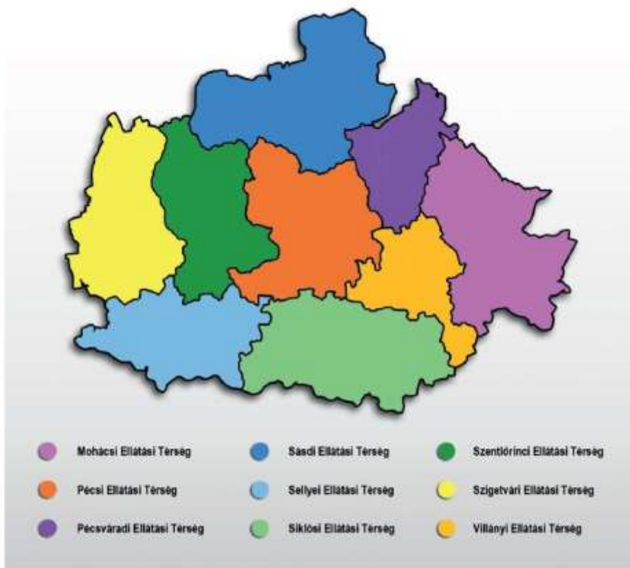
A baranyai KSZR 9 ellátási térsége

Az 2015-ös év elején a Csorba Győző Könyvtár térségi referensei és a könyvtárbuszos munkatársaik saját térségükre, illetve a buszokra vonatkozóan SWOT-analíziseket készítettek, ezekből a „közös nevezőket” emelném ki, elsősorban a gyengeségekre, illetve a veszélyekre fókuszálva, hogy feladatainkat és felelősségünket is világosabban láthassuk.