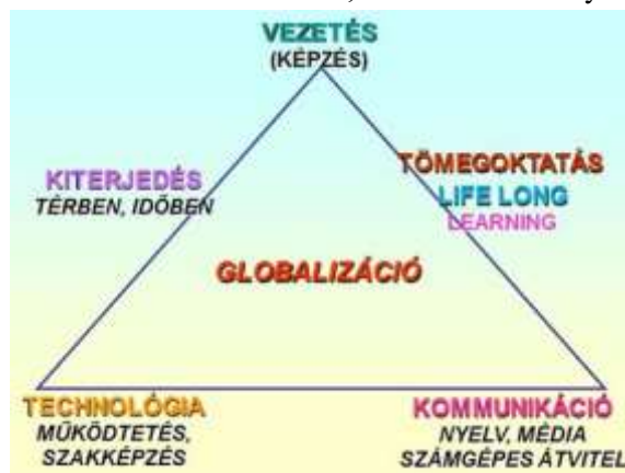
1. ábra A globalizáció modernizációs sarokpontjai [17]