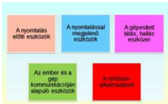
3. ábra A taneszközök öt nemzedéke

A multimédia megjelenésében látszólag csak egy korszerű mikroelektronikai termék. Saját fejlődésükben a korábbi taneszköz nemzedékekhez tartozó eszközök, információhordozó anyagok is korszerűek voltak. Mindazt tudták, ami az adott technika, technológia szintjén lehetséges volt. A lényeges különbség az előző négy és az ötödik a rendszeralkalmazásban rejlik. A fejlődésbeli átmenetet jól érzékeltetik a hagyományos didaktikai funkciókat és az oktatástechnológiai funkciókat megvalósító közvetítési technológiák. Mind a fejlesztéshez, mind az alkalmazáshoz médiaismeretre, felhasználói tudásra ebben az esetben is szükség volt.