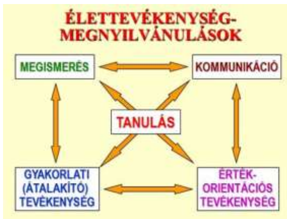
2. ábra A tanulás = élettevékenység!?

A korábbi oktatástechnikai gyakorlattól eltérően az új eszközt, a mikroszámítógépet együtt