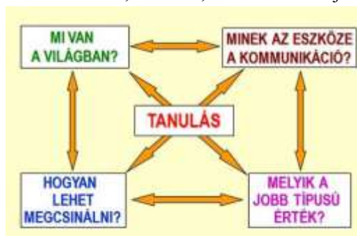
4. ábra: A mindenkor időszerű kérdések

csős tapasztalatával. Az iskolai tanulás kudarcai a konkrét tanulási folyamat részelemei, segítség nélkül a tovább lépés akadályai. Így vagyunk ezzel az írás, olvasás, számolás elsajátításakor. Egy komplex eszköztudásról van szó, ami nélkülözhetetlen, nemcsak az írott, nyomtatott anyagokból történő művelődéshez. A (tanulási) környezet mindig változott. Lehetőségként a mai napig biztosított a taneszközök alkalmazhatósága, használhatósága, fejleszthetősége. Az eredményességhez az aktuális eszköztudás birtoklása alapfeltétel. Sajátos csapdahelyzet, hogy mindig a saját szocializációs és életterünk tapasztalataiból indulunk ki. Ez minden generáció esetében természetes.