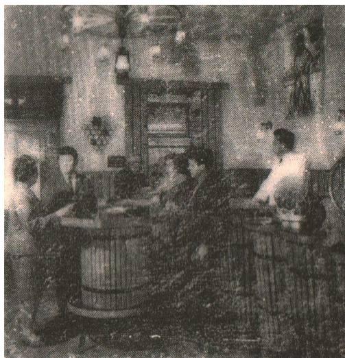
Forrás: ”Siklói bácsi Budapesten”, 1967, p. 4.