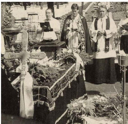
Forrás: Horváth, 1994, p. 7.

A Tenkes kapitánya-kultusz 2020 őszén a települési, 2023 februárjában pedig a megyei értéktárba is bekerült, ugyanekkor célként fogalmazódott meg, hogy – mivel a filmsorozat az ország egészének szívébe belopta magát – a nemzeti értéktárba is felterjesszék. A sorozat készítésének 60. évfordulója alkalmából ismét egész éves rendezvénysorozatot szerveznek Siklóson: kiállítást rendeznek a filmforgatáshoz kapcsolódó relikviákból, meghívják a még élő alkotókat, beszélgetésre invitálják az egykori statisztákat és tematikus képzőművészeti tárlatot összeállítását is megkezdték (Zsíros, 2023; Szűcs, 2023).