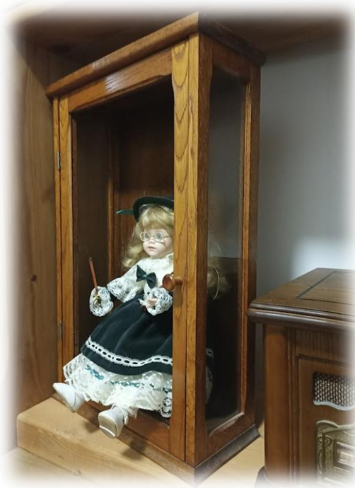
1. kép: Az eltört vitrin hasonlat

Mivel a vitrin volt eddig a baba ismert és védett világa, ezért marad a három oldalán még mindig ép keretben. Ez azonban csak leültetve lehetséges, emiatt a lábai kilógnak az ajtó keretéből az ismeretlen világba, ami érezhetően nem megszokott megoldás, addig marad csak így, amíg a törött üveg pótlásra nem kerül. A baba helyzete azt jelképezi, hogy az egyén (és/vagy közössége) képes alkalmazkodni és megtalálni a problémáira adható válaszokat a régi és az új struktúrák szembeállításával nélkül.