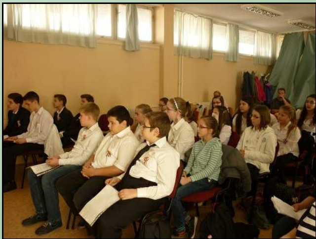
A diák hallgatóság figyelmesen hallgatta a verseket