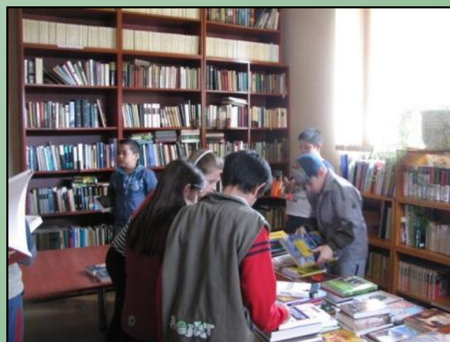
Új könyvek leendő olvasói

A foglalkozás végén magammal vittem egy hangos mesekönyvet az iskolába, amelyet később meghallgathatnak a gyerekek.