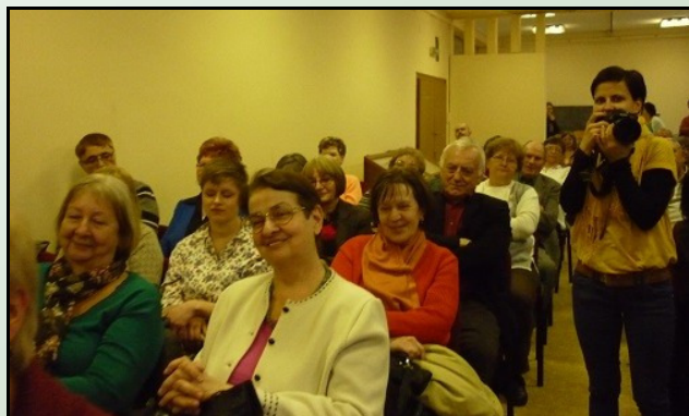
Esterházy Péter tatai előadásán

logikából adódóan – hozzátesz, s egy árnyalatnyit eltérő megvilágításba helyezi ugyanazt a művet, még inkább kiemelve ezzel annak egyediségét. Írásaiban elsősorban a nyelv, a magyar nyelv lehetőségeit igyekeznek legteljesebben kiaknázni és nem a cselekmény felől közelít.