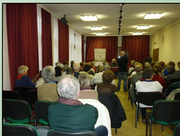
Esterházy Péter a Könyves Szerda vendége volt

Egyik legismertebb művében, a Harmonia Caelestisben erőteljesen jelenik meg a magyar történelem, s ez egyfajta cinkosságot eredményez az olvasó és a szerző között, mert mindannyiunk számára megélt, génjeinkben élő dolgokról beszél.