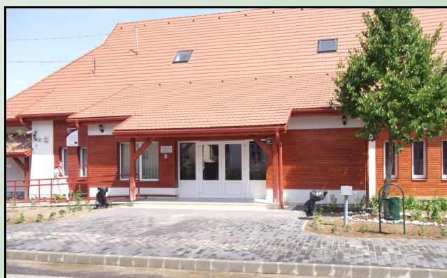
Az új bajóti Művelődési Ház