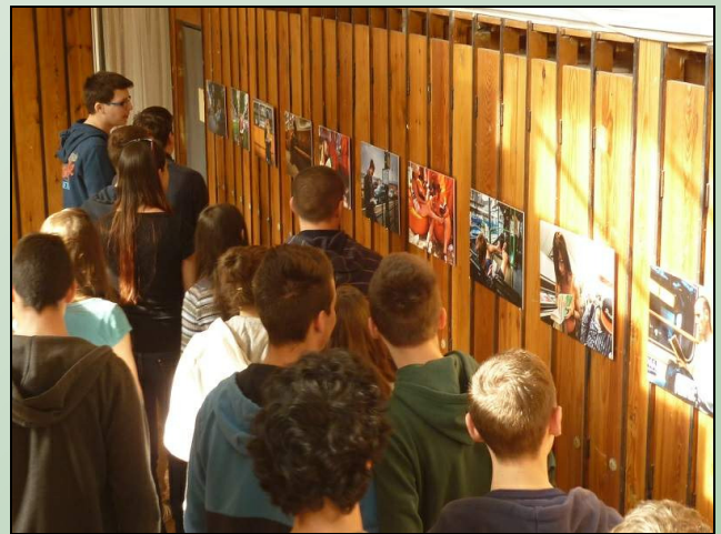
Diákok nézik a kiállított fotókat

utazás nem csak kívülről szemlélhető helyváltoztatás, hanem a könyvbe merülő olvasó belső utazása is egyben. A külső utazás eszköze a metró, busz vagy villamos, a belsőé maga a könyv.