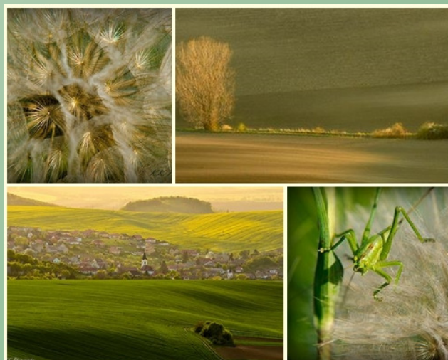
Montázs Kovács Krisztián képeiből

„Hiszem, hogy a vizuális élményen kívül a jól elkészített fénykép közvetít egy látásmódot, életérzést is. Nekem, mint amatőr fotósnak, célom, hogy ezt minél több képemről el lehessen mondani.”