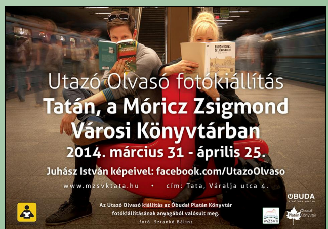
A kiállítás plakátja

A kiállítás – témájából eredően – vonzza a könyvtárakat, így nem csoda, ha vándorkiállítás lett belőle. Elsőként a Gödöllőn, most pedig Tatán látható a negyven fotóból álló gyűjtemény 2014. április 25-ig. A Móricz Zsigmond Városi Könyvtár tervezi Olvasó Pontok megvalósítását a közeljövőben. Reméljük, ez a kezdeményezés is valami új, kedvező folyamatot indít majd el a kulturális életben.