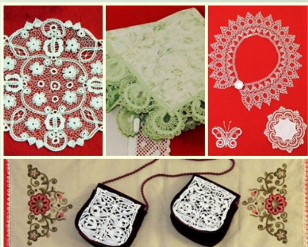
Montázs a kiállított alkotásokból

A folyamatos megújulás sem embernek, sem intézménynek nem egyszerű feladata, mégis, többek közt ezt a célt szolgálják a könyvtárainkban rendezett kiállítások. Amíg a Fő téri Könyvtár/Képtárunkban az első negyedévben fotókat és festményeket mutattunk be, addig Népház Úti Fiókkönyvtárunk látogatói selymfestményekben, gyermekkönyv-illusztrációkban gyönyörködhetnek.