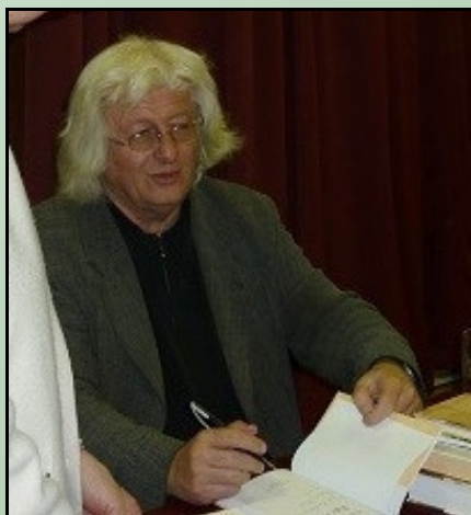
Esterházy Péter dedikál

Egy barát érkezett a tatai könyvtárba 2014. március 5-én, aki - bár most járt itt először -, mégsem volt idegen. Nemcsak a városhoz köthető személyes szálak miatt, hanem megnyerő egyénisége folytán. A személyes kapcsolat közvetett és többszálú: Édesapja itt érettségizett a tatai gimnáziumban; a város valaha az Esterházy uradalomhoz tartozott; nagymamája pedig a közeli Majkon, illetve Csákváron élt. A majki nyarakat idézte is az egyik regényrészlet, melyet hallgathattunk az este során.