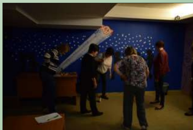
Munkában az alkalmi nyomozók