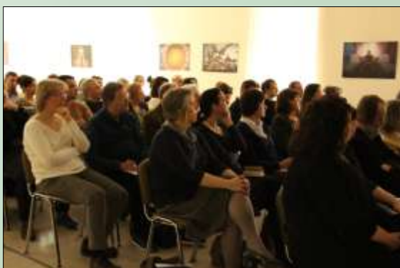
A műhelynap vendégei.

könyvtárosaként. „ Győr 1945 előtti történetének kutatása ” című előadásában számba vette a 18. századi publikációktól kezdődően a várossal foglalkozó legalapvetőbb, és a monográfiához elengedhetetlenül fontos nyomtatott forrásanyagokat, ideértve az időszakos sajtót és repertóriumait is. Néhány példával illusztrálta is e többeszes halmazt, amelynek jelentőségét nem kellett eléggé hangsúlyoznia az érdeklődők számára. Szerzői tanulmánykötetek, közgyűjteményi kiadványok, a Streibig nyomda termékei, egy-egy jelesebb személyiség munkásságát ismertető tisztelgő kötetek kerültek a hallgatóság elé. Az előadó néhány gondolattal jelezte forrásértéküket is. Összefoglalásában – Kaposi Zoltánhoz kapcsolódóan – a teljeskörű bibliográfiai számbavétel és a digitalizáció fontosságát emelte ki. Ismerjük meg, hogy hol vannak fehér foltok, és hogy lehet ezeket pótolni. Új megközelítések és tapasztalatok kellenek, hogy valóban 21. századi és győri legyen a majdani monográfia – zárta gondolatait.