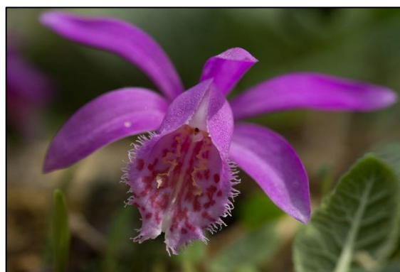
Pleione formosana – Ez az orchidea fajta is megél a kertemben.

A madarak etetését is befejeztük április közepétől, így marad a kirakott odúk, virágok, rovarok, két-éltűek, kis emlősök lesése. Megjegyzem, ez sem okoz kevesebb örömet. Amint az idő és hőmérséklet felengedett, az élet beindult. Elég lassan ugyan, még csak pár bogár, rovar száll a levegőben, de amint megjön az igazi meleg, egyre több állat bújik elő vackából. Az eddigiekről szól a 2. számú karanténfilmem.