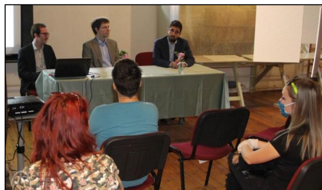
A fénykép a májusi sajtótájékoztatón készült.

népszámlálás, Conscriptio Ignobilium ), erre nem kerülhetett sor, ismétlődő folyamattá nem váltak. Az első, szabályozott, „formanyomtatványok” alapján végrehajtott népszámlálásra 1784 és 1787 között került sor, alapvetően katonai céllal. A következő, a népesség egészét számba vevő összeírásra a neoabszolútizmus idején, 1850–1851-ben került sor. Alapvetően ez még ismételten az osztrák szervek katonai jellegű népösszeírása volt. A következő, 1857-es összeírás során már elsősorban demográfiai szempontokat tartott az államszervezet szem előtt.