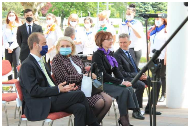
A megnyitó pillanatai.

Nagyon izgultunk, azt hiszem, kivétel nélkül mindenki izgatott volt a dolgozók közül, hogy minden rendben működjön, a technika ördöge nehogy megréfáljon minket, hogy mindent megtaláljunk elsősorban a hatalmas olvasói térben .... és még sorolhatnám.