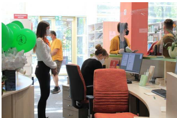
Első olvasóink.

2020. szeptember végétől egészen 2021. május 28-ig nem jöhetett olvasó a Könyvtárba, előbb a bezárás, a költözés, majd a Kormány által megszabott rendelkezések miatt. Persze mi örültük annak egyrészt, hogy nem kapkodva kell „belaknunk” ezt a hatalmas, új épületet, hanem bőven volt időnk mindenre, hogy valóban felkészülve tudjuk fogadni a tatabányai és a vonzáskörzetéből ideseregülő tömegeket.