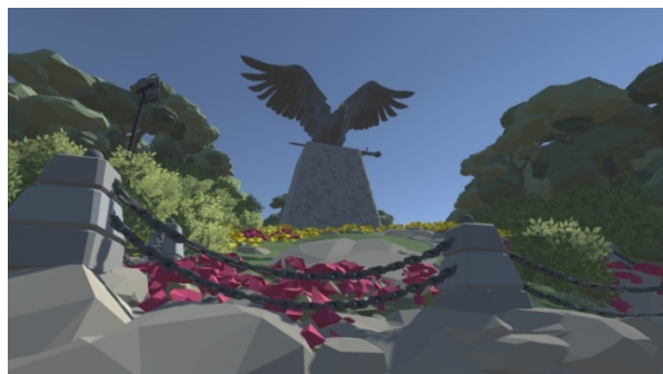
A Turul-emlékmű a VR-alkalmazásban

melyek szabadtéri, a bányászati emlékhelyekkel kapcsolatos aktivitásra buzdítják a résztvevőket, sikeresen összekapcsolva az online és az offline teret. A sportkihívások eredményeképp közel kétszáz résztvevő járta vagy kerékpározta végig a tatabányai bányautat, szelfizett, gyűjtötte a pontokat, miközben megismerkedett városunk múltjával.