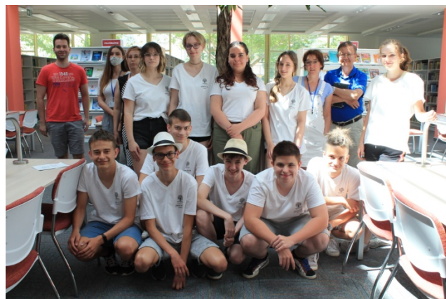
A médiatábor résztvevői.

A pandémia kellős közepén értesültünk róla, hogy az NKA Közgyűjteményi Kollégiuma pályázatot hirdet helyismereti médiatáborok szervezésére középiskolások számára. Mint általában szokott lenni, itt is igen szűkös volt határidő. Az nem volt kérdés, hogy pályázunk, még annak ellenére sem, hogy nem lehetett tudni, vajon a tervezett június közepi időpontban, már lehet-e egyáltalán táborokat tartani. Tanácskoztunk, ötleteltünk, végül megszületett a pályázati anyag. Erőfeszítésünket siker koronázta, hiszen több mint 600 ezer forintot nyertünk, és a járványügyi intézkedések is fellazultak a nyárra.