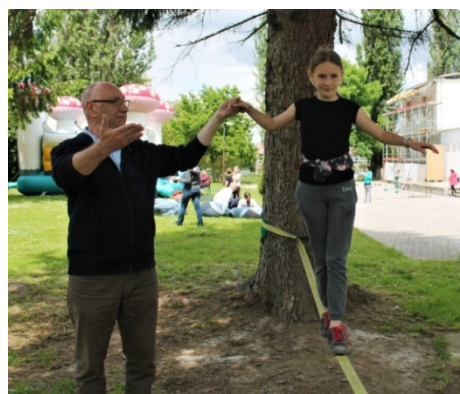
Slackline a gyakorlatban