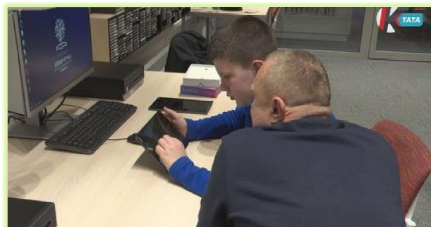
Tabletes foglalkozás az autista gyermekekkel