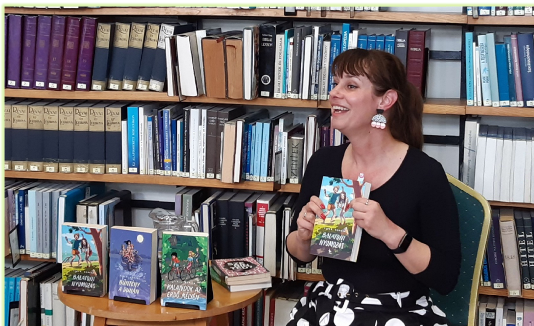
Fiala Borcsa

A gyermekek az író-olvasó találkozó alatt óvón tartották kezükben saját könyveiket, amelyeket dedikálásra hoztak magukkal. Vendégünk örömmel osztott autogramot miközben a fiatalok kérdésekkel halmozták el. Egyeseknek nem titkolt szándéka, hogy írókká váljanak, néhányan már elindultak ezen az úton. A gyermekeket nemcsak az írás, hanem a könyvkiadás is foglalkoztatta, tényleg komolyan gondolták szándékukat. Miután a csoportkép elkészült a találkozó legmeghatóbb pontja az elköszönés volt. A gyermekek még órákig faggatták volna az író nőt, aki biztatta őket, hogy ne csüggedjenek, bizonyára még találkoznak, és facebookon, instán megtalálják őt.