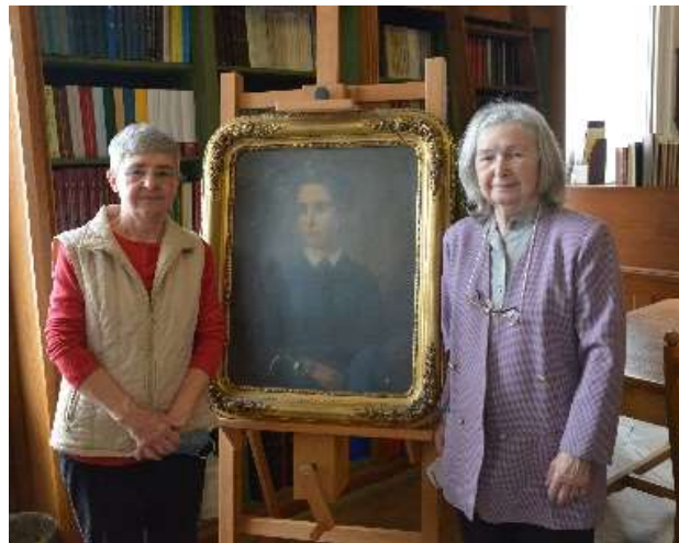
Táncsics Mihály ükunokái

Az alkalmilag készült kiállításon tárgyi emlékekkel, könyvekkel, képekkel és levelekkel, a kort is jól dokumentáló iratokkal vártak minket.