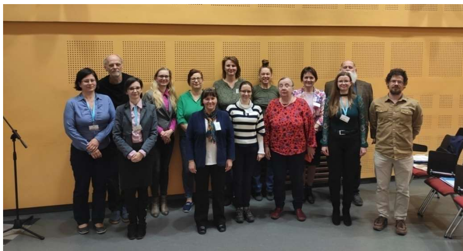
Zöldkönyvtárosok csoportkép

Köszönet a házigazda könyvtáron túl a Nemzeti Kulturális Alap és az Europa Direct Tolna támogatásáért, hogy ez a találkozó létrejöhessen.