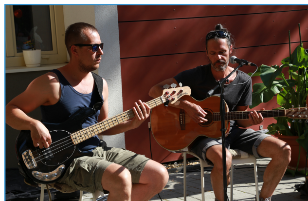
Coffee City

Persze nem néma csöndben várták az írók olvasóikat: két fantasztikus helyi együttes a Carters Country Duó és a Coffee City zenekar szolgáltatott egész délután háttérzenét.