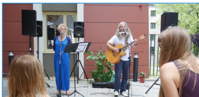
Csuda Mini együttes

A piknikhez természetesen falatozás is társult: saját készítésű süteményekkel és házi szörppel vártuk izgatottan, hogy az olvasók is jó ötletnek tartják-e, amit kigondoltunk.