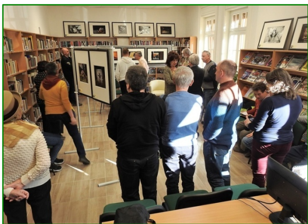
A Helios fotóklubkiállítása

Újabb induló kiállítással sem maradtunk adósok. Március 28-án nyitottuk meg az észak-komáromi Helios fotóklub „A KÖNYV” című kiállítását. A tárlat keretében igazán sokszínű és művészi könyves értelmezéseket láthatunk április 21-ig.