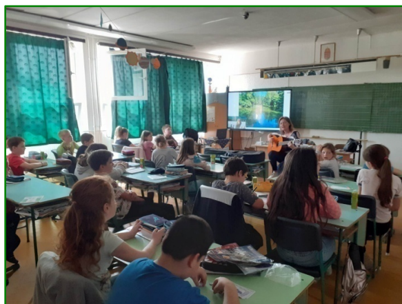
Fotó: Bacsáné Fuli Anikó

A tatai Móricz Zsigmond Városi Könyvtár csatlakozva a foglalkozásokhoz szavalóversenyt és az iskolákba kitelepült előadásokat szervez.