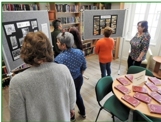
Komáromi emlékek – képeslap-kiállítás

Májusi eső, cserebogár, Munka ünnepe, Anyák napja, orgona, gyöngyvirág, eper, strandok nyitása, esküvők, fagyoszentek, májusfa, Gyereknapi, Pünkösdi - ezek jutnak először eszünkbe, ha erre a tavaszt záró hónapra gondolunk. De hol van már a május 1-jei strandnyitás! Az idei május mintha két külön évszakban lett volna. A hónap első felében őszi idő volt, hideg, esővel. Szabadtéri megjelenésünk a mostoha időjárás miatt rögtön egy zárt térbe áthelyezett programmal kezdődött. Terveinkben több további, az udvarunkba szervezett esemény volt, ami szintén az időjárás miatt - vagy elmaradt vagy belső térbe került. Május közepétől aztán hirtelen nyár lett. A meleget, a napsütést azonban nyári záporok tarkították, továbbra is a falak közé szorítva minket. Borús égbolt alatt teltek a napok, igaz derűs hangulatban.