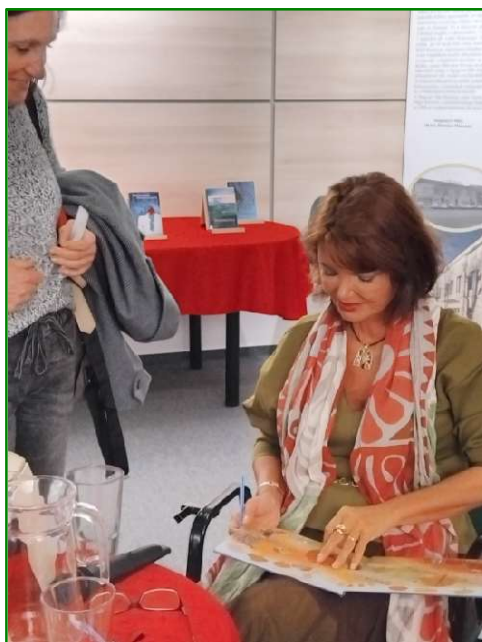
Tóth Krisztina

November 4-én Tóth Krisztina József Attila-díjas költő, író volt könyvtárunk vendége. A szerző elárulta: fáradtan érkezett hozzánk, mert az elmúlt hetekben rengeteget utazott. Októberben mutatták be ugyanis a Majom szeme című regény angol, illetve olasz fordítását, így a szerző egy hónapon belül járta be New Yorkot és Olaszország különböző területeit.