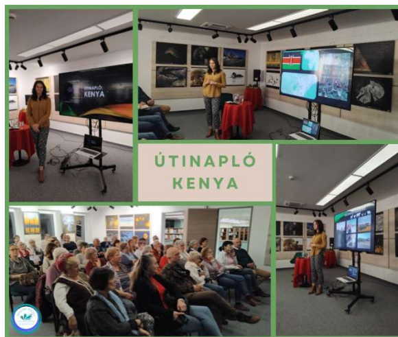
Útinapló Kenya

Közben ők maguk is sokat tanultak, megismerték a kenyaiak tárgyakban szegényebb, viszont személyes kapcsolatokban gazdagabb, kevésbé rohanós életét. Milyen kézzel mosni, csirkét tartani, motorral járni, piacon vásárolni, esküvőn részt venni Afrika szívében? Ezekre a kérdésekre mind választ kaphattak a fényképes útibeszámoló résztvevői.