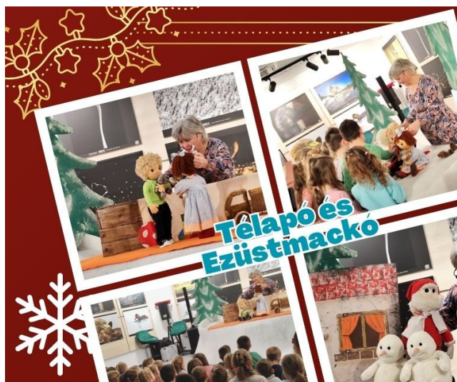
Fotó: Makó Liliána

MAKÓ LILIÁNA, MAGYARY ZOLTÁN TUDÁSKÖZPONT ÉS KÖNYVTÁR