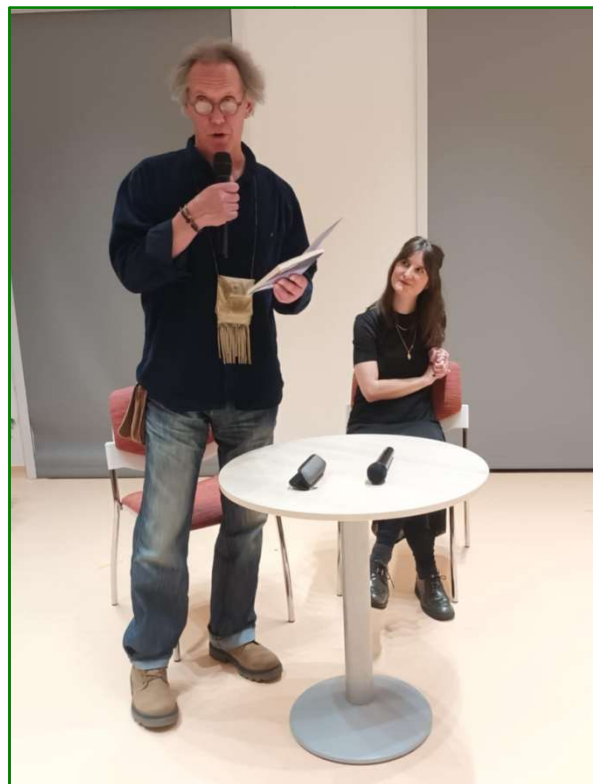
(UFO Nyitott Rezervátum, József Attila Könyvtár, Tata-bánya, 2025. december 23.)