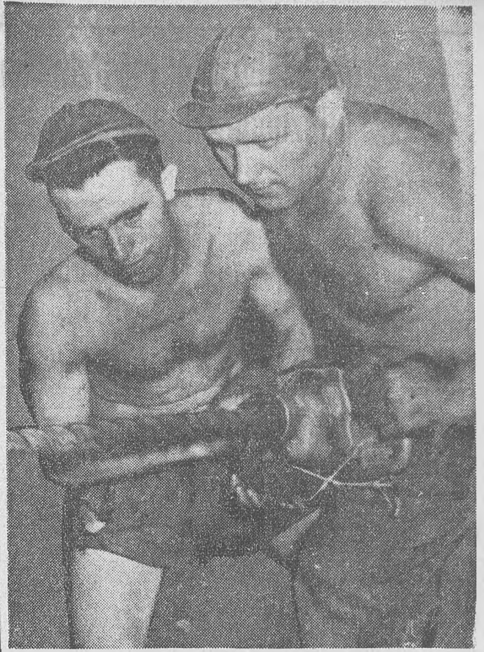
Eredményes, jó munkával köszöntik az idei bányásznapot is a tárnák hősei

Az angol külügyminisztérium szóvivője megismételve Butler belügyminiszter július 30-i parlamenti kijelentését, közölte, hogy az angol kormány nem javasolja az atomkísérletek folytatását mindaddig, míg „az atomkísérletek felfüggesztésével foglalkozó értekezleten hasznos tárgyalások folynak”.