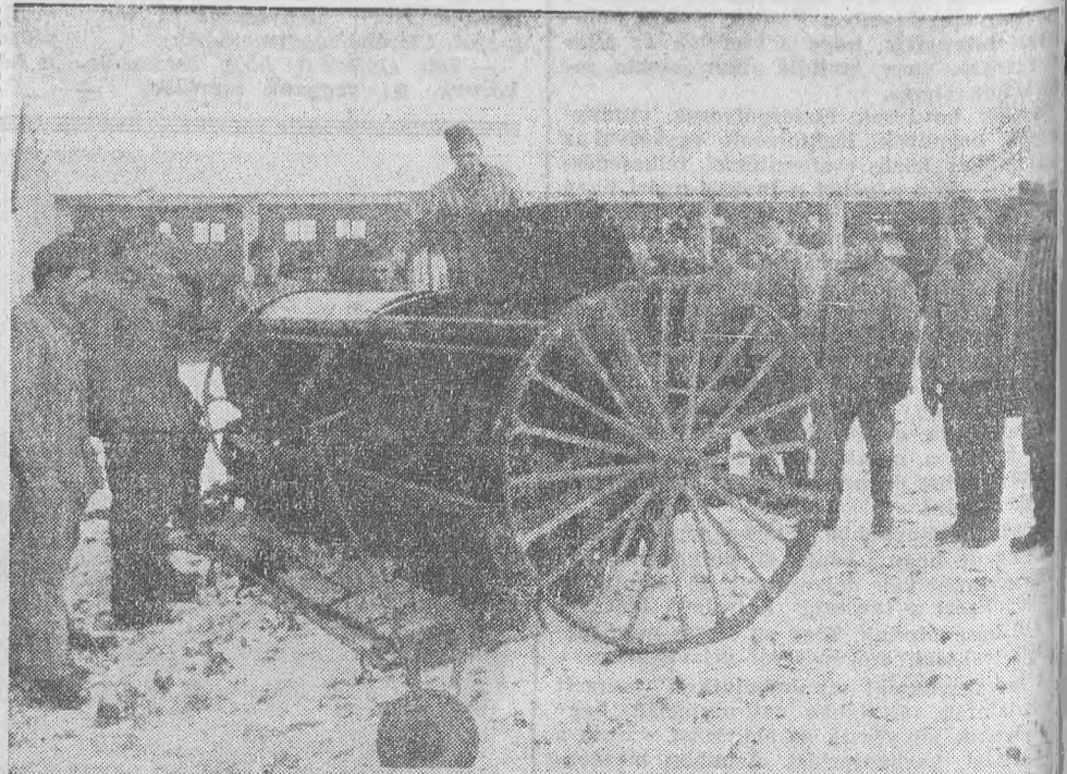
A különböző típusú traktorok vezetése mellett a munkagépek működését is elsajátítják az elítéltek. Képünkön: az egyik csoport a vetőgépek működését tanulmányozza