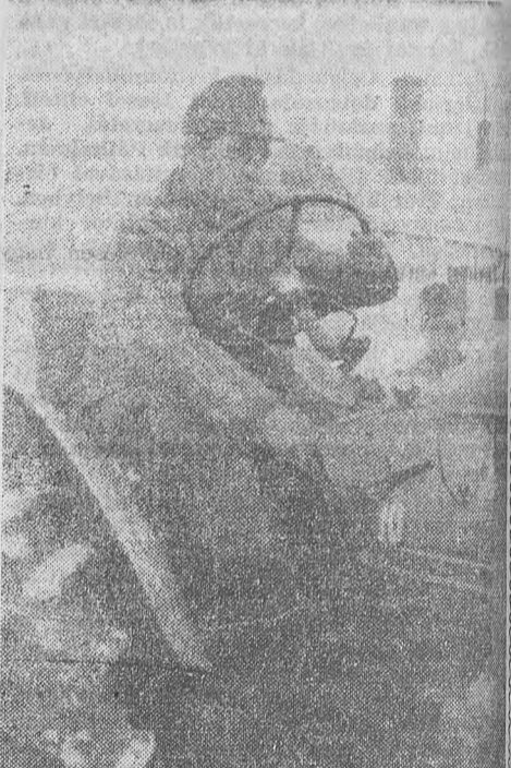
Még egy kapcsolás, s pőföve elindul a Zetor géppallosas havas udvarán

Külön érdemes szólni azokról az elítéltekről, akik a szabad életben gépkocsivezetők voltak. Ők a többiekkel szemben bizonyos fölkü előnyben voltak, hiszen foglalkozásukkal fogva ismerték a motorok szerkezetét, működését és a vezést. Ezek az elítéltek igen sok