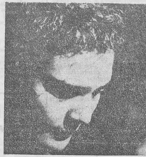
Bara Margit az arisztophanészi komédiában

Valóban, Arisztophanész kacagása mellé bármit lehet társítani, ez a keret, úgy látszik, mindenre lehetőséget ad, ám egyet igényel, ugyanolyan legyen a játékosság iránya, hangja, minősége. Ez a stílus mindent elbír, a vas-komédiázás drasztikumát és profán szellemeskedést, csak egyet nem, a szellemtelenséget. Gyánitom: Arisztophanész korában sem tekintették a szöveget szentírásnak, talán inkább a szituáció-teremtés, a tréfálkozás alkalmainak, amelyben szabadon mozoghatott a színész, szabadjár, engedhette játékos kedvét és parodizáló készségét. Arisztophanész bölcsessége megóvta attól, hogy kifáradjon a játék, aktuális célzásai minduntalan felszárthatóak a közönség figyelmét. Sajnos, nem ez jellemzi a mai előadást. Jobban szórakoztat és izgat az, amikor Arisztophanész szólal meg a színpadon, mint amikor az átdolgozó szövegeit halljuk. Sőt: olykor Arisztophanész modernebbnek hat, mint az, ami