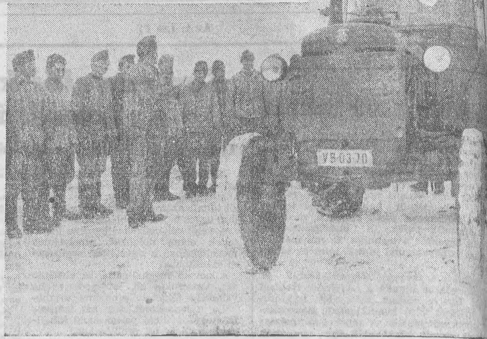
A gyakorlati foglalkozások során a tanfolyam hallgatói csoportokra osztva sajátítják el a vezetés technikáját. Indulás előtt a csoportvezető eligazítja az elítélteket

Már a tél sem a mozdulatlanság időszaka falun. A mezőgazdaságban végbement hatalmas változás a téli hónapokat is elevenné tette. Elsősorban nem a fizikai munka tölti be ezeket a napokat — bár az állattenyésztők, a gépjáratók teljes erővel dolgoznak —, sokkal inkább a gondolkodás, a tanulás időszaka a mostani.