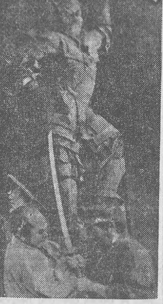
Masaki Kobayashi Japán rendező „Harakiri” című filmjét a zsűri különdíjjal tüntették ki.

A különdíjak is helyes mérték szerint kerültek döntésre.