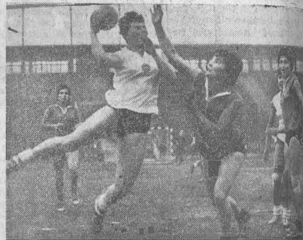
Támad és gólt ér el a magyar csapat

A jó talajú Kisstadionban, 800 néző előtt, a jugoszláv Pupics szipjelére ebben az összeállításban kezdte a játékot a két csapat: