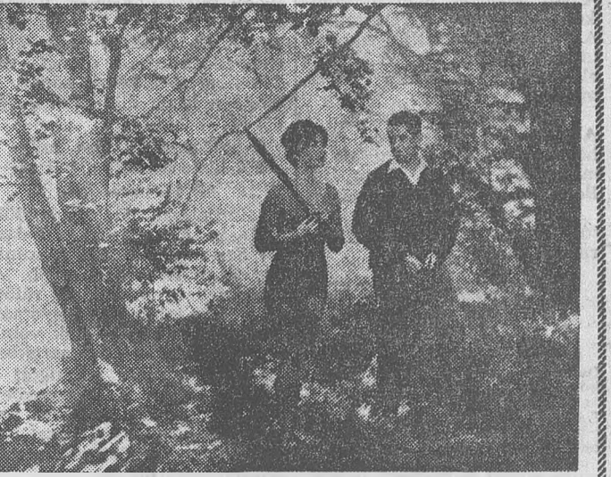
A zsűri különdíjjal jutalmazták Jasny, csehszlovák rendező „Amikor a macska jön” című filmjét. Káprázatos technikai trükkök, szatirikus mondanivaló, jóízű humor, és sok szerelem... A csehszlovák filmgyártás „Amikor a macska jön” produkciója a fesztivál egyik meglepetése. Vojtech Jasny, a fiatal rendező realista leleplező tartalommal tünt meg a meghökkenő alapötletet, amely egy kedves címszóval szól. Ha a macska leveti szemüvegét, másként látja a világot: az emberek valódi és eddig rejtett tulajdonságai kerülnek napvilágra. A szerelemesek vörös, az irigyek sárga, a gyűlölködők illa színben jelennek meg a macska — és a közönség előtt...

A darab könyvalakban is hamarosan megjelenik. A filmjogokat de Beauregard francia producer vette meg.