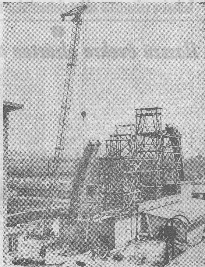
Nagyszabású felújítást és építkezést folytatnak Vácott a Forte-gyárban. Új épületekkel és berendezésekkel bővítik a gyárat, s a teljes rekonstrukciót 1965-ben fejezik be. A felújításra 300 millió forintot fordítanak. Képünkön: Beemelik a gyár saját tervezésű szárító alagútját a hármasszámú papírgyárhoz

nül kapta Nyíregyháza az ország egyik legnagyobb és legmodernebb almatárolóját a közelmúltban. Alig építették meg, máris kicsinek bizonyult: a tervek szerint újabb kétezer vagonos befogadóképességű épületrésszel bővítik. Nem is annyira tároló, inkább gyümölcskombinát ez. 1964-ben az új nyíregyházi konzervgyár is dolgozni fog már.