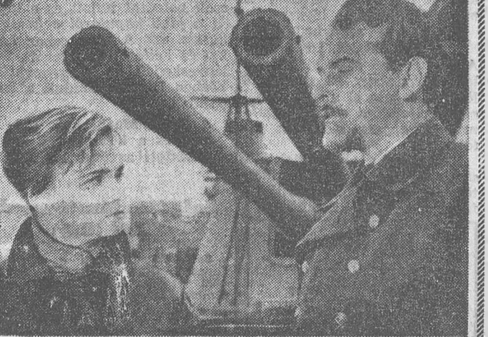
„Egy forradalmi eposz legjobb életrekelteséért” kapott kitüntetést az „Optimista tragédia” című szovjet film