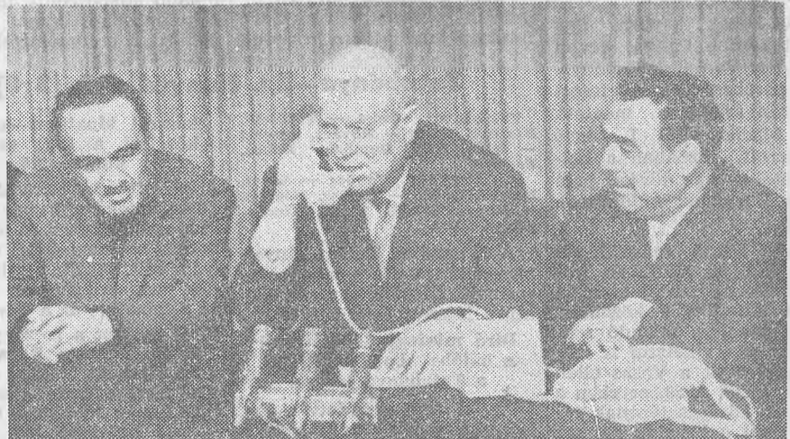
Hruscov, Brezsnyev és Mikojan telefonon beszél az űrben keringő Bikovszkijjal és Tyereskovával.