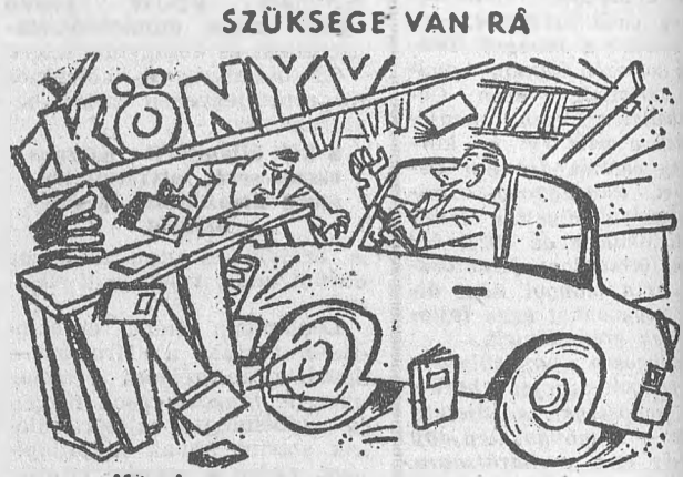
- Kérek szépen egy új KRESZ-könyvet!

Az áruházban minden elektromos és műszaki cikk kapható, a személyzet készséggel ad szaktanácsot az érdeklődőknek a készülékek használatára vonatkozóan. Vállalják a megvásárolt gépek hazaszállítását és otthoni beállítását.