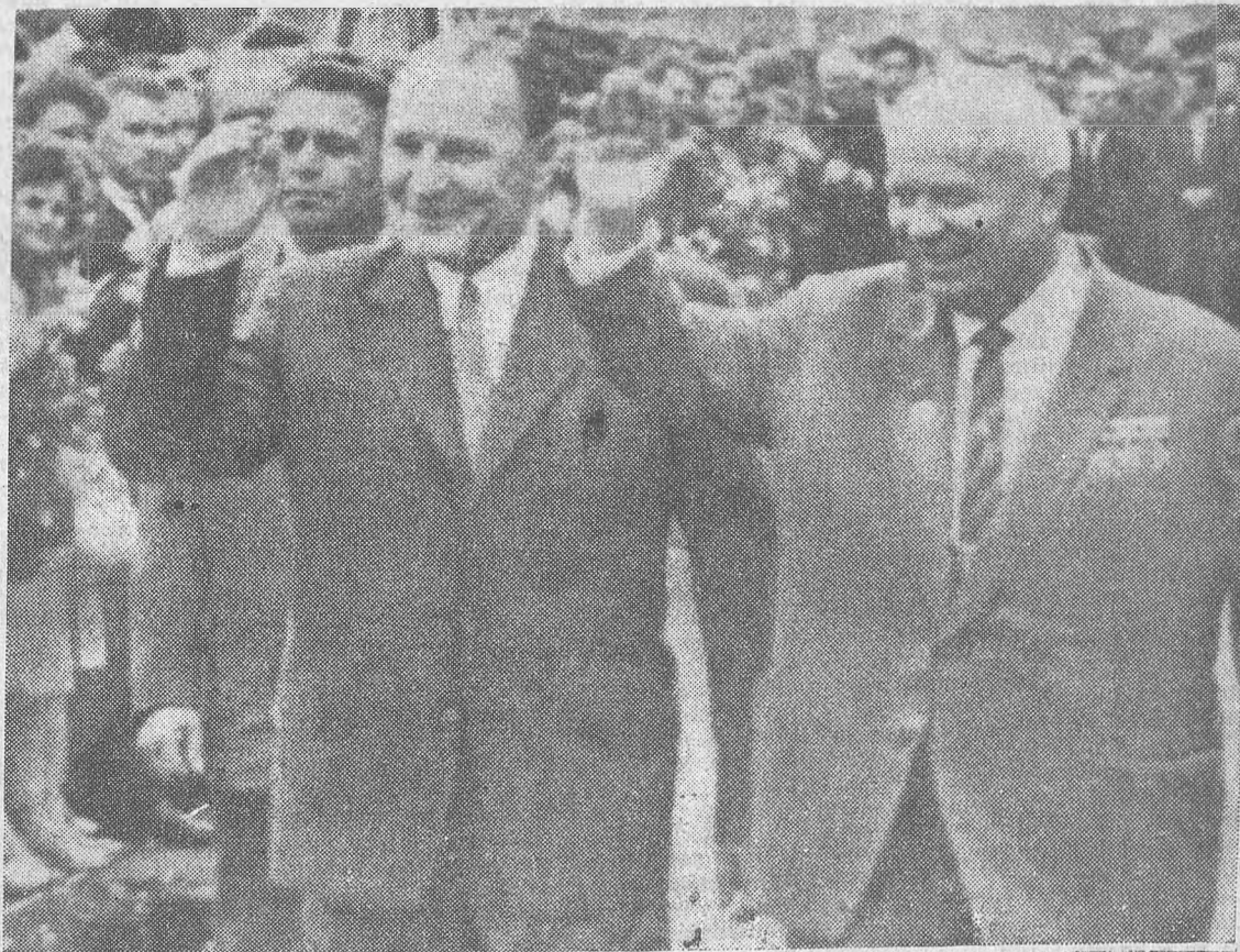
Magyar párt- és kormányküldöttség utazott Moszkvába. Képünkön N. Sz. Hruscov és Kádár János üdvözlő a küldöttségünk fogadására összesereglett moszkvai dolgozókat.

— Éljen a megbonthatatlan szovjet—magyar barátság! Még egyszer üdvözlöm önöket, kedves vendégeink szovjet földön!