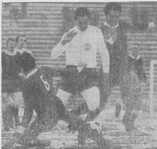
Olykor két tatabányai védő őrizte Albertet.

A labdarúgó-premier néhány mérkőzése az időjárást idézte: váratlan események borzolták a kedélyeket. Ha az ökölvívó csapatbajnokság szótárából kölcsönözünk kifejezéseket, akkor a Bp. Honvéd k. o.-val veszített Győrött; a bajnokjelölt újpestiek Salgótarjánban még az sem segítette, hogy gyakran kettős fedezékbe vonultak; a Vasassal nem volt azonos süllycsoporthoz a SZEOL, az FTC pedig akkor támadta, rohamozta ellenfelét, amikor kedve tartotta.