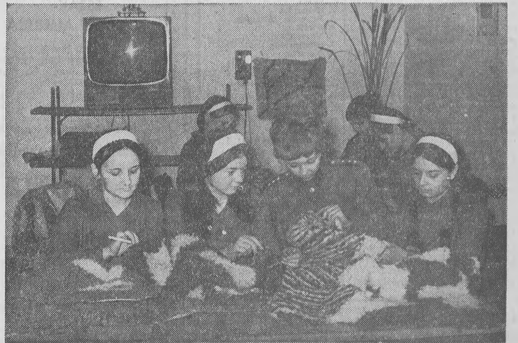
A kézimunka-szakkör tagjai ismerkednek a subaszőnyeg készítésével