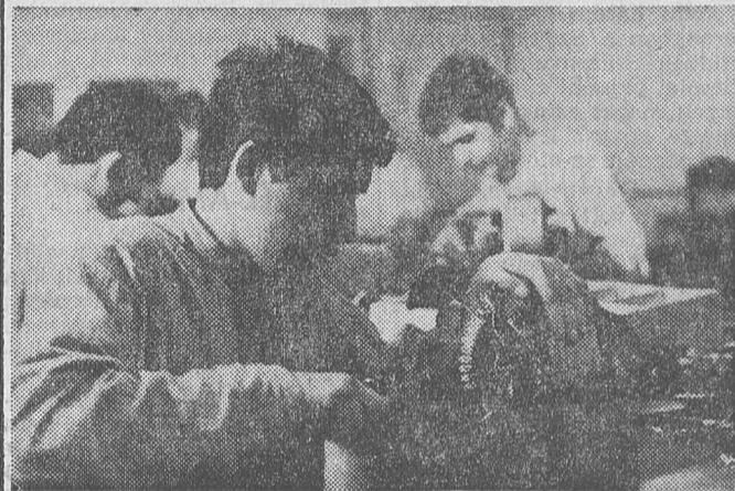
Bonyolult munka a motorszerelés