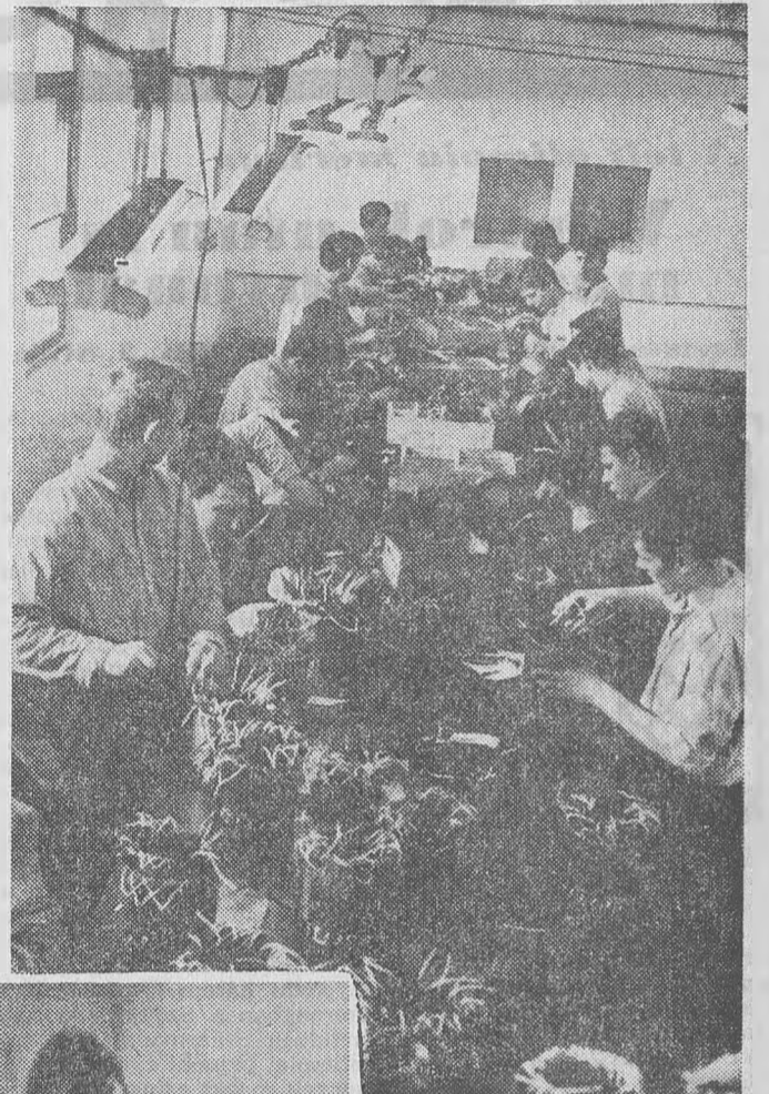
Tágas, világos teremben dolgoznak