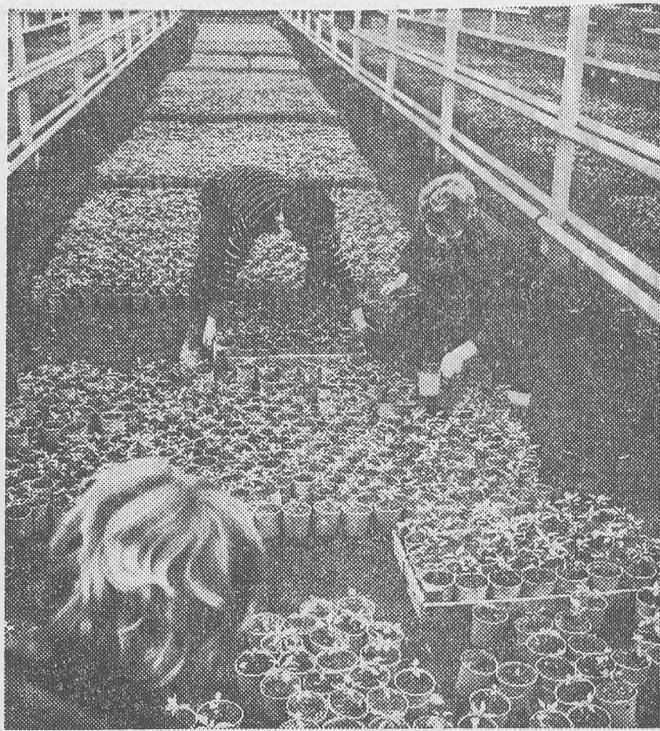
Az Inotai Erőmű tőszomszédságában, 80 millió forint költséggel felépült hazánk legnagyobb üvegháza. Rövidesen 6 hektáron terem itt a paprika és a paradicsom. Az erőmű által fűtött hatalmas üvegházakban áprilisban már szedhetik a termést. Képünkön: locsolják a palántákat