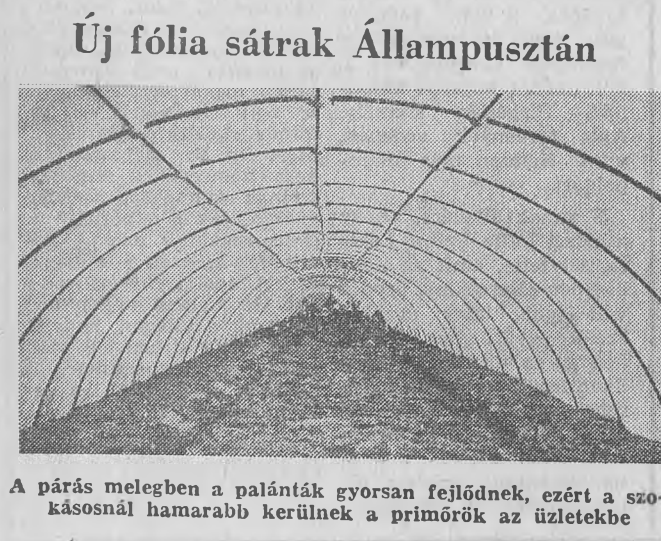
A párás melegben a palánták gyorsan fejlődnek, ezért a szokásosnál hamarabb kerülnek a primőrök az üzletekbe