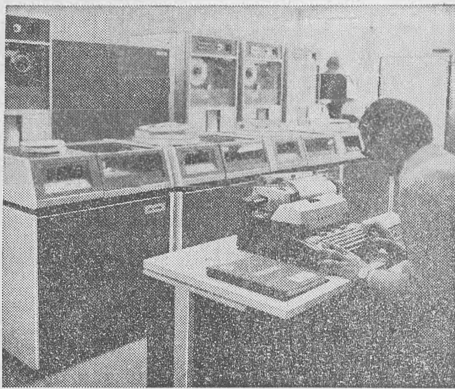
A Központi Statisztikai Hivatal Számítástechnikai és Ügyvitelszervező Vállalat szegedi számítógépközpontja a növekvő igények ellátására R 20-as számítógépet kapott 50 millió forintos beruházás keretében