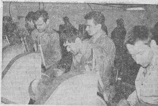
A csiszoló sor