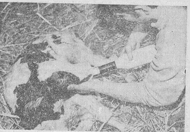
Első próbálkozás a tejjel, ezúttal a felvétel kedvéért.