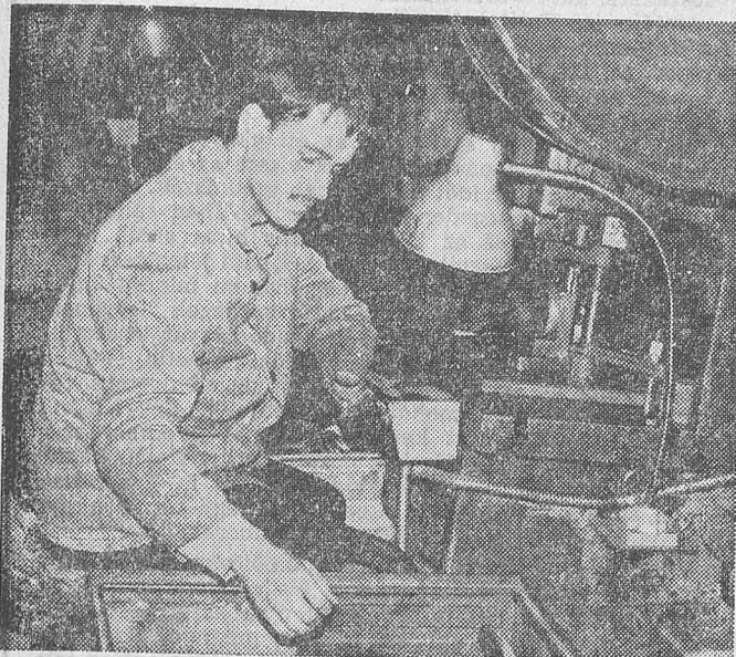
Gép az ember szolgálatában

Sokáig kopogunk, mire nyílik a kis üzem ajtaja. A hosszúságú csarnokban serény munka folyik: csiszolnak, vágják, sorjáznak, amolyan igazi vasipari ténykedés látható. Mint megtudjuk, az itt dolgozók a Magyar Optikai Műveknek gyártanak bér munkában különböző fémmatricsákat. Emitt az ismert fürdőszobai mérleg fémrészét csiszolják, másutt az órák — kerek, lábbon álló ébresztőórák — hátlapját és számlapját készítik el, szinte teljesen, hogy az anyavállalatnál már csak magát az óraszerkezetet szerelik bele, illetve ott kapja meg tetszetős külső formáját.