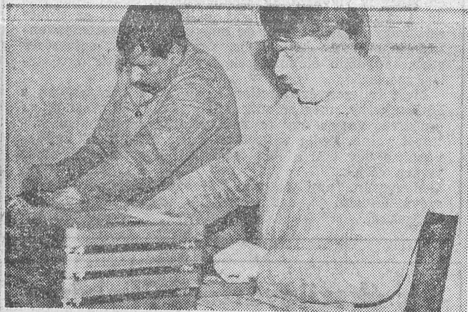
A fürdőszobai mérlegek fémrészét csiszolják

S talán a MOM és a bv. intézet együttműködése nemcsak üzlet, hanem több is annál. Még annyit: az üzemből dolgozók többsége nem testi fogyatékos, remélem mégis, elnézik, hogy most nem róluk esett szó.