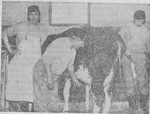
Szakértő beavatkozásra készen...