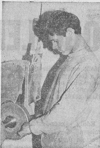
A fiatalember siketnéma

Nem tudom, kitől származott az ötlet, hogy ilyen bér munkát vállaljanak a bernátkúti elítéltek? Nem tudom, kinek jutott eszébe, hogy a testileg nem teljesen ép embereket itt foglalkoztassák, de megemelem a képzeletbeli kalapom előtte. Hiszen az önmagában hátrány, beilleszkedési gondokat okoz, ha valaki testi