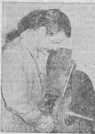
Szükség van a fizikai erőre

Nézem a fiatalembert: születése óta félkarú, és valóban nehézség nélkül tudja kezelni a gépet, adagolni a munkadarabokat. Külön kis terembe érkezünk, itt „újítják” fel a csiszolókorongokat. Megszólítom a ténykedő fiatalembert, de nem válaszol, nem is válaszolhat. Nem hall és nem is tud beszélni. Kísérőnk tolmácsolása után kiderül — vajon mi lehet a bűncselekménye? —, hogy gépkocsit lopott, ezért kapott négy hónapot. Sajnos, már visszaeső. A képzeletbeli szalag végén ül a meős, ókomoly beteg, csak könnyű