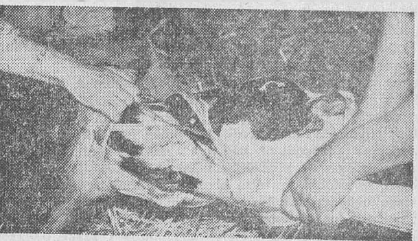
Túl a nehezen