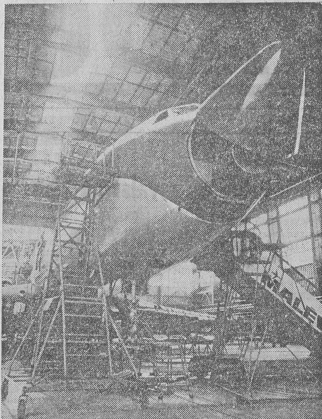
A Ferihegyi repülőtér új szerelőműhelye

A városi tanács már döntött arról, hogy a fel- szabaduló épületeket, tan- termeiket az új igényeknek megfelelően kell hasznosi- tani. Így a felújított Kun Béla Általános Iskola négy tantermében az ősszel köz- gazdasági szakközépiskola- sok kezdik meg a tanulást. A két iskola néhány perces sétára van egymástól.