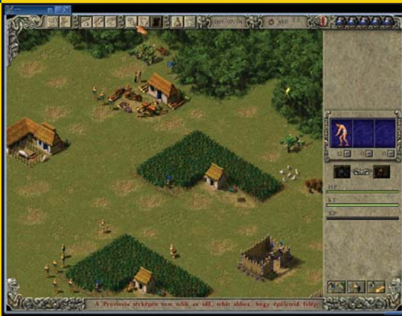
4. ábra Munkában a rabszolgák