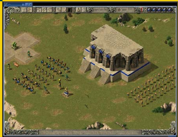
5. ábra Már induláskor is hatalmas a sereg!

küldetéseit személyesen kell megélnünk. Az Azték világban egyaránt nagy szerepet kap a harc, a diplomácia és a felderítés is – ezen felül a varázslatok, találmányok és a véres áldozatok is a javunkat szolgálhatják. Birodalmunk alappillérei a rabszolgák, akiket felül állnak a varázslók, harcosok (köztük akár jaguáridomárok is). A vezető (csakúgy, mint bármely kiemelt személy) hatékony védekezésre általában képtelen: a fő egységek ezért minden áron megvédendők, haláluk a küldetés azonnali végét jelenti. Az összetett játékményt, és a teljesen szabad lehetőségek adják a Theocracy világának sajátosságait. Az irányítást és a kezelést szerencsére könnyen el lehet sajátítani, mivel minden egyes felirat magyarul szól hozzánk, a „Kezelési útmutató” menüt pedig még videobetétek is segítik. Ezeket a videókat nem javallott átlépni: néhányszori megtekintésük megfelelő rutinnal ruházza fel a játékost.