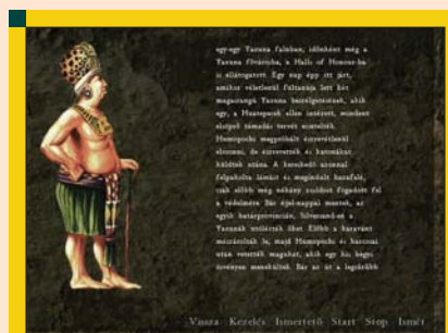
3. ábra Egy küldetés története

A játék izometrikus nézetű világa az Azték mondák felé kalauzolja az érdeklődőket. A XV. századi Közép-Amerikában a tenger felől érkező idegen hódítók és a velünk szomszédságban élő csoportok egyaránt fenyegetést jelentenek frissen szerzett provinci-