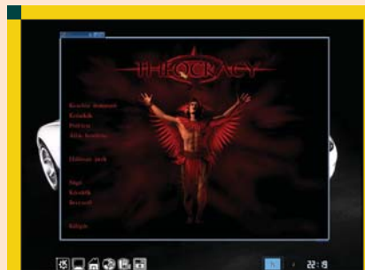
2. ábra A Theocracy Linuxon, KDE felületen fut

képezt. Ezzel azonban nem értek véget a megpróbáltatások: Zsolt később szoftverjogi problémák miatt sajnos szabadságvesztésre ítéltetett. A programhoz ebből adódóan nincs naprakész frissítés, hiszen maga a Philos Lab csapata is megszűnt létezni. Összességében a Theocracy mára egyfajta posztumusz-projekt szerepet tölt be, igen nehéz beszerezhetőséggel. A hozzáférést illetően szinte csak két csatorna létezik. Egyikük a http://www.tuxgames.com online rendelési lehetősége, a maga 42 dolláros ajánlatával. A másik út sajnos az illegálishoz közelít: a hazai fejlesztésű játékprogram a p2p fájlcsere hálózatok egyik gyakori vendége.