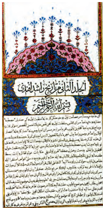
A Tárihi Rásid második kötetének első oldala

Kátib Celebi-nek a tengeri háborúról írott műve, amely 5 gyönyörű rézmetszetes térképet is hoz. 1730-ban orientalisztikai témájú könyveket is nyomtatott, a Tercumen tarihi seyyah , az 1720-as afgán, perzsa háborúról szóló könyvet. A történeti munkákban, különösen érdekesek a haditechnikáról szóló illusztrációk, városok, védművek támadási tervének rajzai, ami a kor haditechnikáját kutatók számára még ma is tartogat meglepetéseket. A hadművészetről szóló munka a nyomda kilencedik kiadványa volt 1732-ben, I. Mahmut szultánnak ajánlotta. Nyugat-India története ( Tarihi Hindi Garbí ) különlegessége az, hogy egy Ptolemaiosz Klaudiosz utáni csillagászati térképet is közöl. A csillagászat az Oszmán Birodalmon belül igen fejlett volt, mondhatni a mindennapok részévé vált, hiszen a Ramadán idején fontos volt a Nap lementének pontos meghatározása, a böjtöt akkor törhették meg, amikor a Nap lebu-kott a horizonton, egy perccel sem előtte, s ennek kiszámításához pontos csillagászati és matematikai ismeretekre volt szükség. Különböző városokban és a Birodalom különféle részein ez természetesen más-más időpontban következett be. A hajózás, nemcsak a haditengerészet