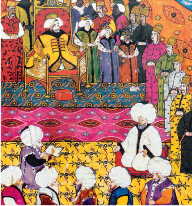
III. Ahmet szultán és három fia a Korán felolvasását hallgatják. A miniatúra Müteferrika korát idézi.

kül volt a Fényesség Porta minden alattvalója. Ez nem azt jelentette, hogy nem voltak könyvek. Voltak. A másolóműhelyekben kézzel írott, a kalligráfiát művészi fokra emelő írnokok keze közül csodálatos vallási, vagy bölcséleti témájú könyvek születtek. No, és Koránok minden méretben és az írás művészetének minden lehetséges megjelenési formájában. Azonban a XVIII. századi Török Birodalom sem kerülhette el a reformokat, amiket egyébként az európai kapcsolatok révén maguk a szultáni udvar tanácsadói is szorgalmazták. Az egyébként a műveltségéről és a reformjairól híres szultán III. Ahmet, a tulipán korszaknak nevezett időszakban maga is mellé állt a nyomda alapításának, az erről szóló engedélyt 1727-ben adták ki. A nyomda ügyének két magas rangú tisztségviselőt is megnyert, Sadrazam Nevsehirlí Ibrahim pasát és Seyhülislam Kirimli Abdullah efendit. Mindez azt bizonyította, a porta számára is fontos volt a nyomda alapítása, mintegy a műveltség jelképének, a birodalom világiásodásának jeleként tekintették. Szükség is volt a magas pártfogókra, mert a modernizálásnak nem volt