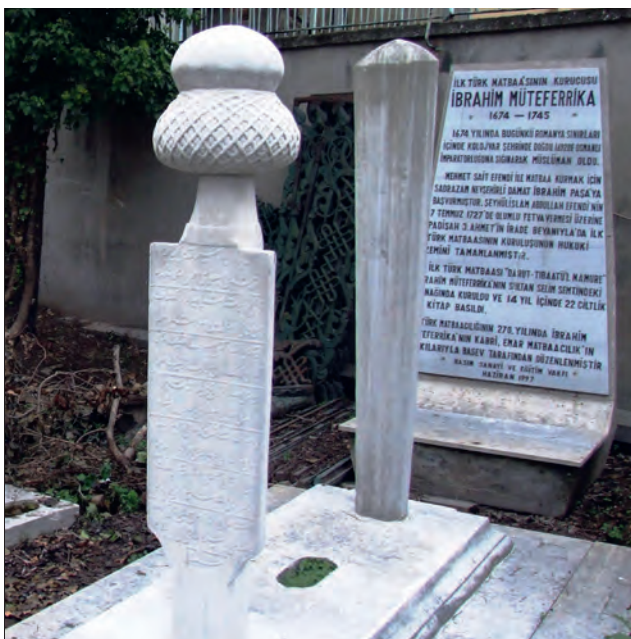
Ibrahim Mütefferika sírja, Isztambul, 2011

miatt, hanem a fejlett és igen kiterjedt kereskedelmi hajózás miatt is a jó csillagászati térkép minden kincs-nél többet ért, hiszen a tájékozódás szintén a csillagok állása alapján történt. Történeti nyomtatványai között kiemelkedően fontos a közép-ázsiai bálvány és hódító, Timur Lenk története, ami Tárihi Timur gürgân címen jelent meg. A Tárihi Misrilcedid az ó és új Egyiptom történetét mutatja be. Ugyanebbe a vonulatba sorolandó a Kalifák rózsakertje című munkája, ami Bagdad történetét írja le.