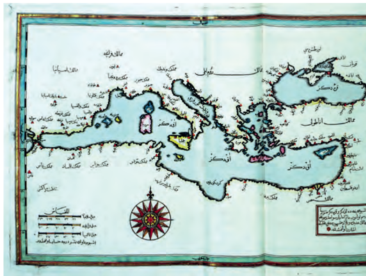
A Földközi- és a Fekete-tenger térképe, Ibrahim Müteferrika egyik műve

is juthatott. Ilyenformán érthető Ibrahim Müteferrika előmenetelének az útja. A Birodalomban a boldogulás első lépése az iszlám hitre térés volt. Hogy miért az Ibrahim nevet kapta? Talán mert Ábrahám volt a keresztneve, vagy mert a keresztény próféták nevét az iszlám vallás is elfogadja és szívesen használja a törökösített változatát, de az is lehet, hogy az egyistenhit megalapítóját, Ábrahámot mind a keresztény, mind az iszlám vallás prófétaként tiszteli, s így adott, hogy a keresztény hitről muszlimmá vált fiatalember az Ibrahim