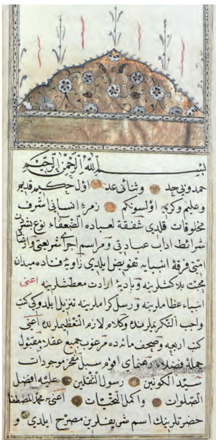
Müteferrika önéletrajzának egy lapja, a Risále-i Islamiyye

tagja lett. Óriási ívű pálya ez, amit minden bizonnyal hűségének, tudásának és szorgalmának köszönhetett. Szép jövedelmet is tudhat magának, amint azt az 1745. november 25-én kelt forrás igazol.