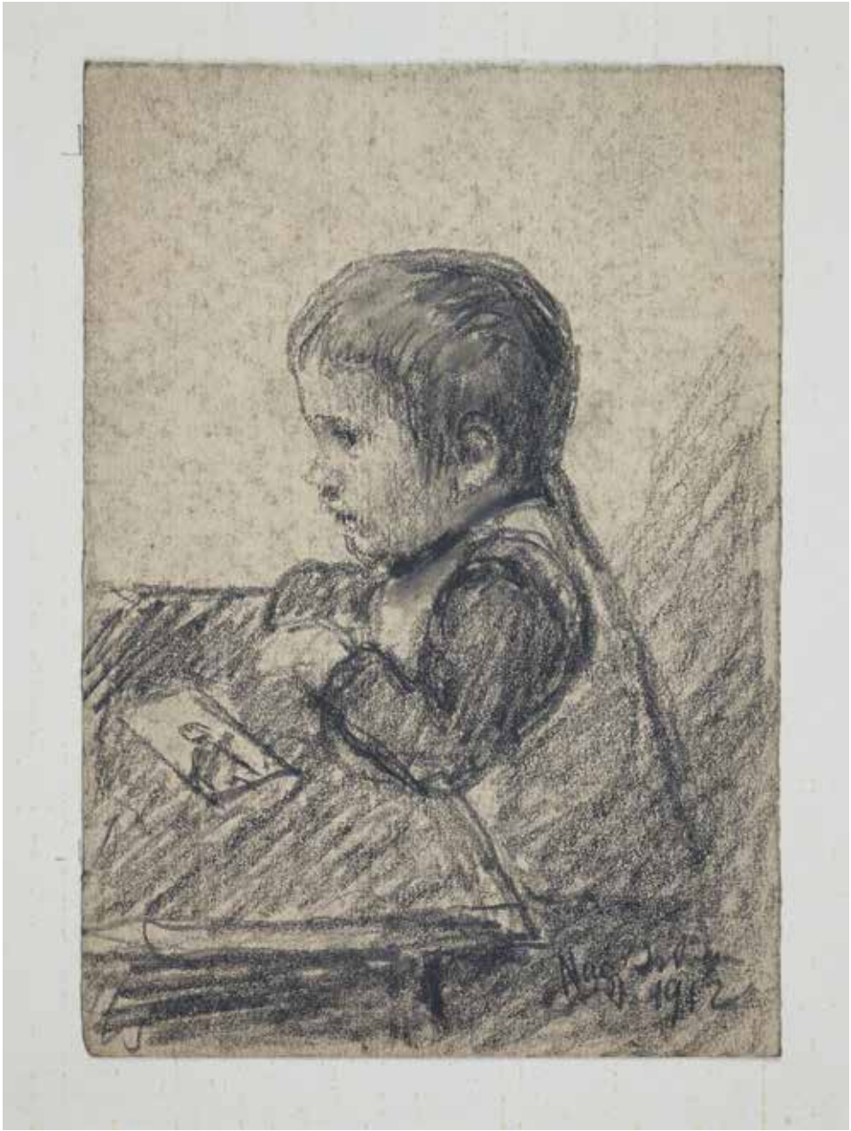
Gyermekprofil, 1912, 15,7×10,7 cm, ceruza, papír, Csíki Székely Múzeum, Csíkszereda