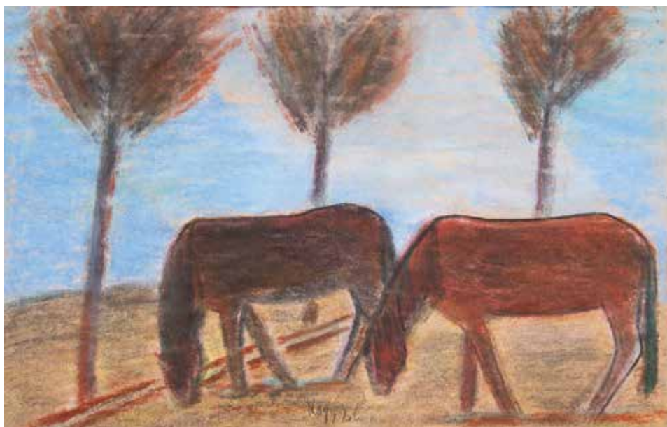
Legelésző lovak, 1920-as évek, 29×43 cm, pasztell, papír, Türr István Múzeum, Baja