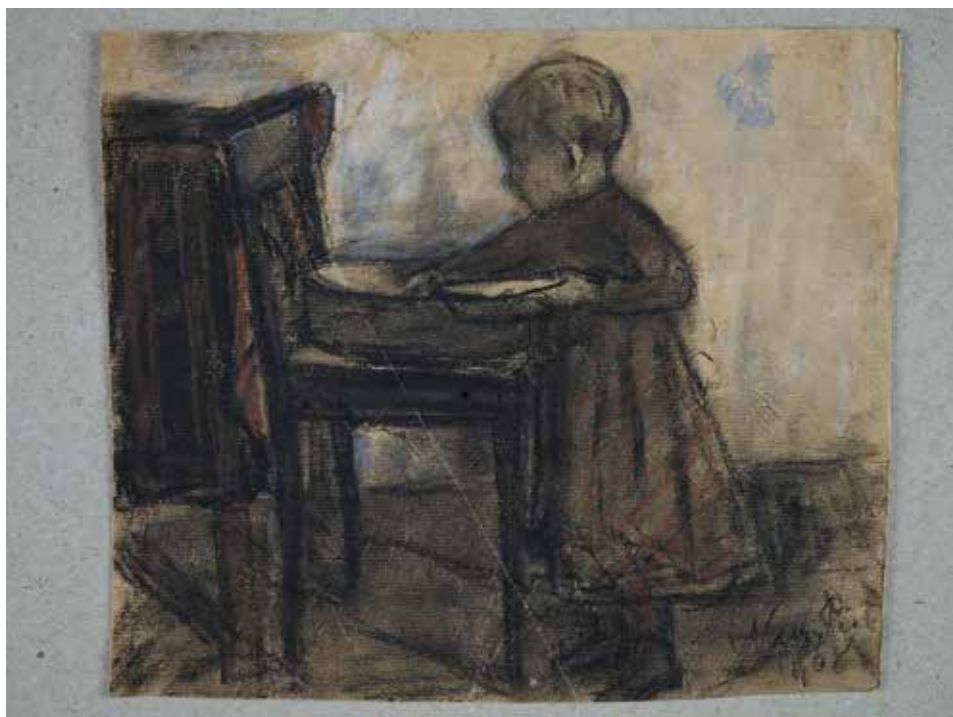
Mosakodó gyermek, 1908, 16,5×19,2 cm, szén, kréta, papír, Csíki Székely Múzeum, Csíkszereda