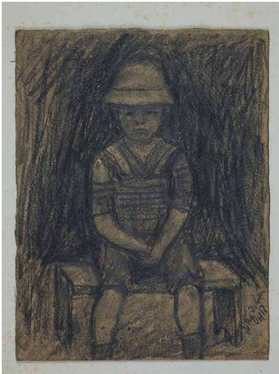
Kicsi széken ülő fiú, 1912, 15,4×11,7 cm, ceruza, papír, Csíki Székely Múzeum, Csíkszereda