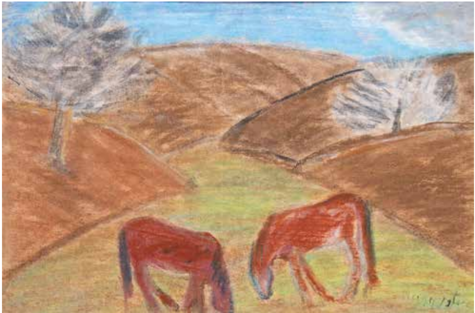
Két ló a dombok alján, 1920-as évek, 29,5×43 cm, pasztell, papír, Türr István Múzeum, Baja