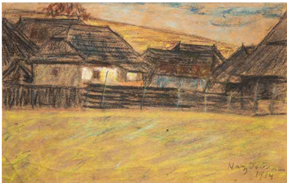
Csikmindszenti házak, 1914, 22,5×31,2 cm, pasztell, papír, Türr István Múzeum, Baja