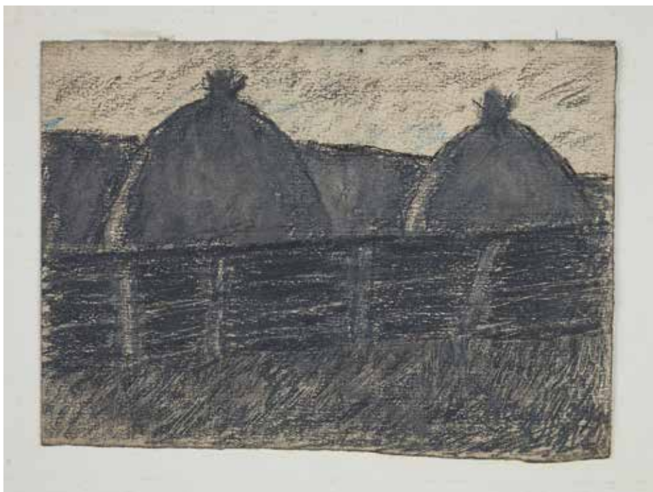
Boglyák a kerítés mögött, 1912, 11,2x15,2 cm, ceruza, papír, Csíki Székely Múzeum, Csíkszereda