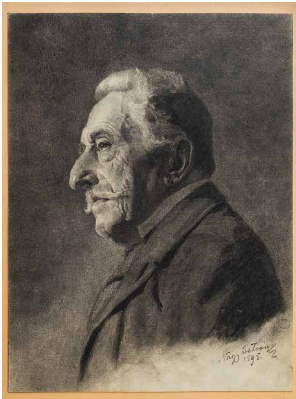
Férfi tanulmányfej, 1895, 49,5×37 cm, ceruza, papír, Magyar Képzőművészeti Egyetem