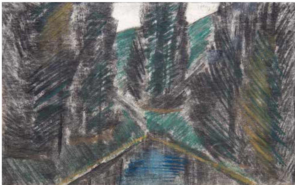
Fenyves a hegyoldalon, 1920 körül, 28×42 cm, pasztell, papír, Türr István Múzeum, Baja