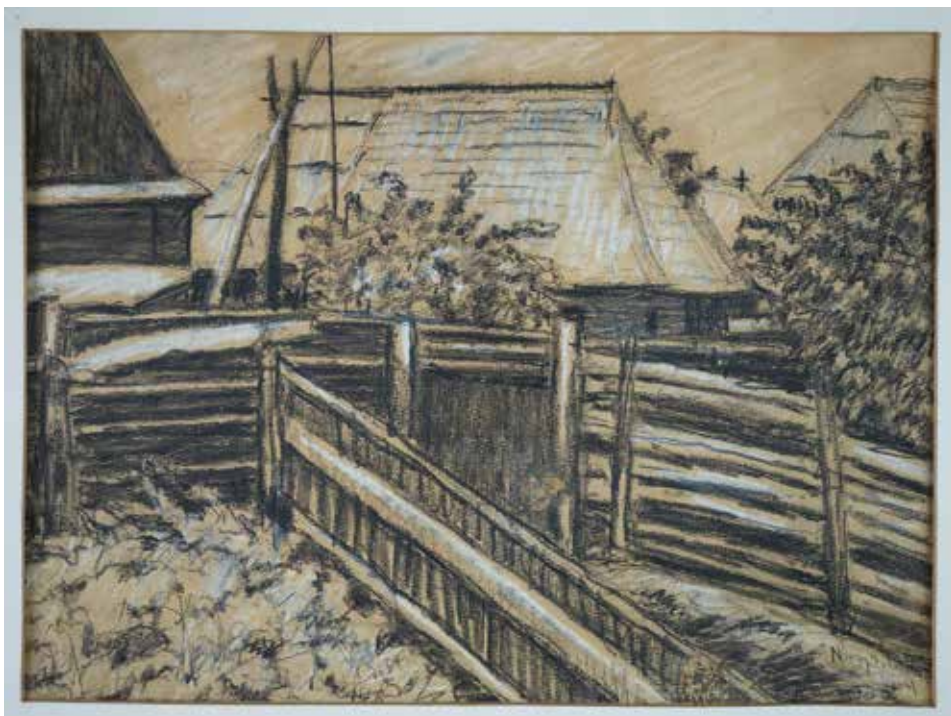
Ház kerítéssel, 1914, 29,3×39,7 cm, pasztell, papír; Csíki Székely Múzeum, Csíkszereda