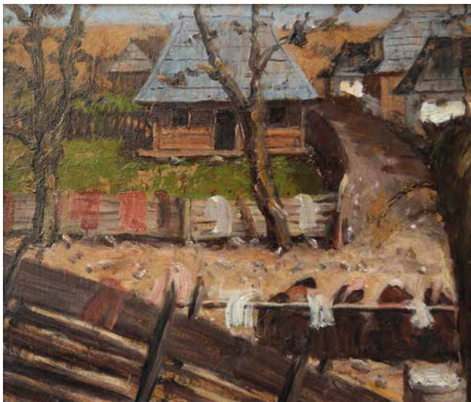
Csíkmindszenti utca, 1910 körül, 31x36 cm, olaj, karton, Türr István Múzeum, Baja