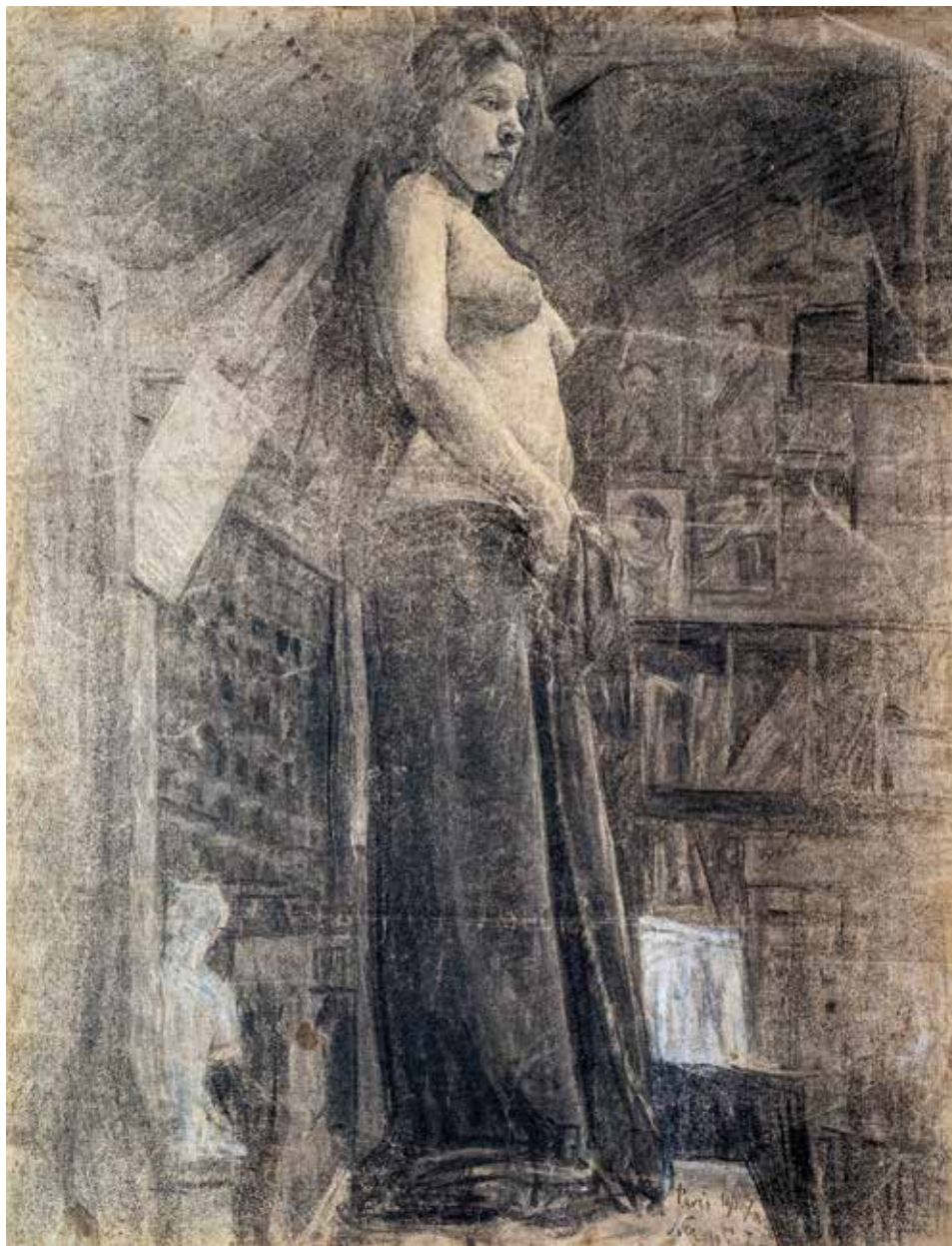
Akt, Párizs, 1900, 61,9×47,3 cm, szén, papír, Csíki Székely Múzeum, Csíkszereda