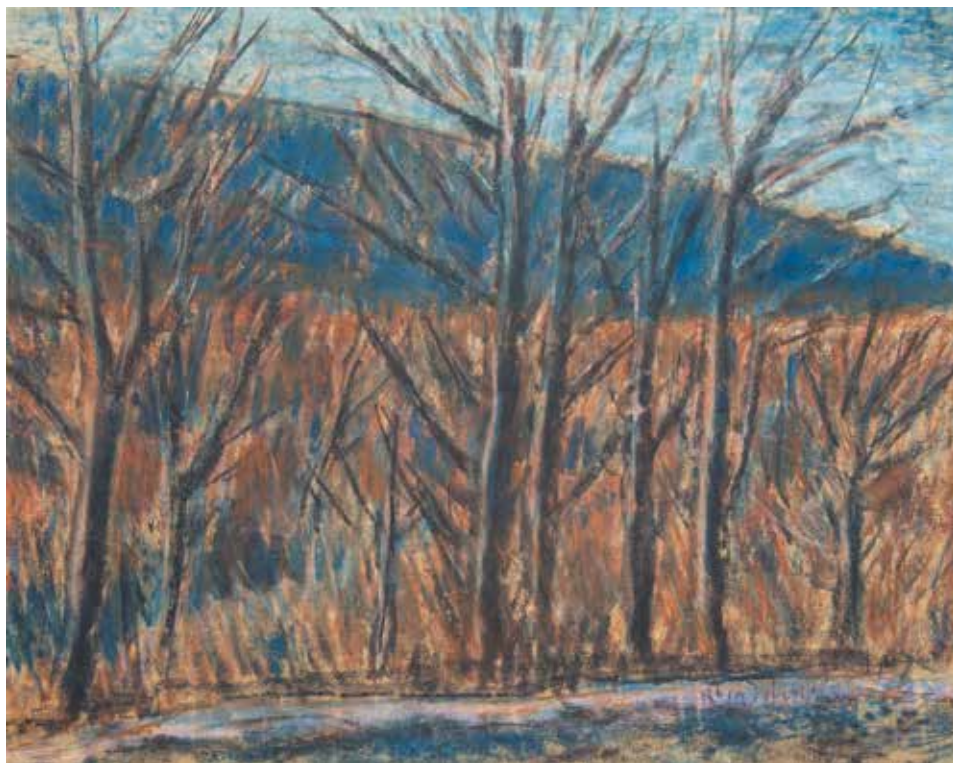
Domboldal fasorral, 1920-as évek, 42×57 cm, pasztell, papír, Türr István Múzeum, Baja