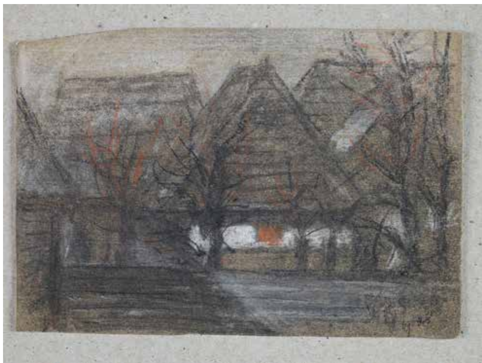
Mindszenti házak, 1908, 10,7×15,6 cm, szén, kréta, papír, Csíki Székely Múzeum, Csíkszereda