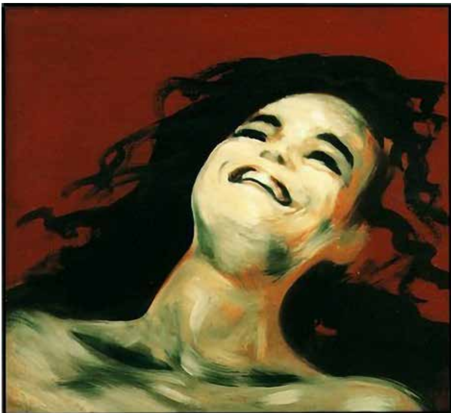
Cim nélkül II, 1995