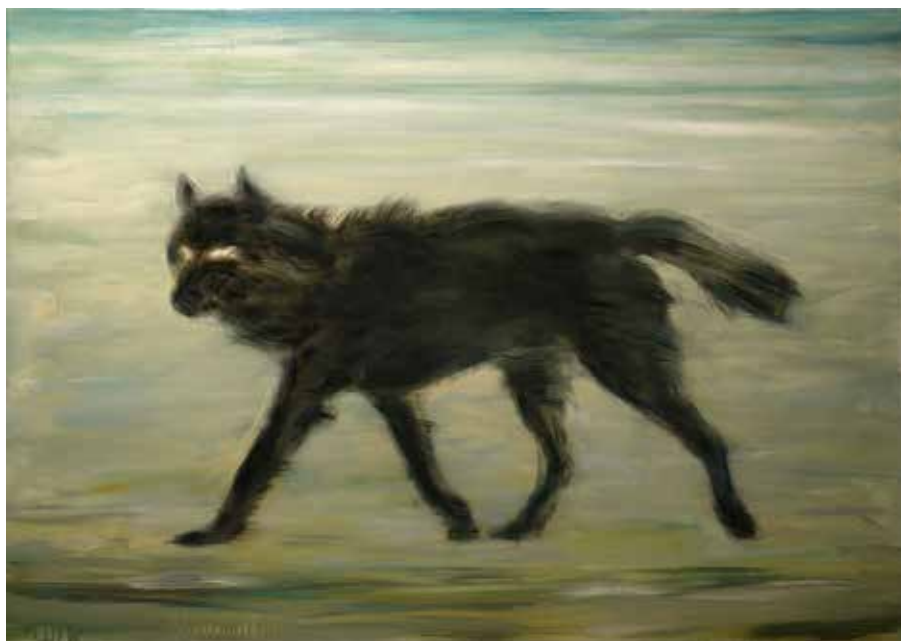
A magányos farkas