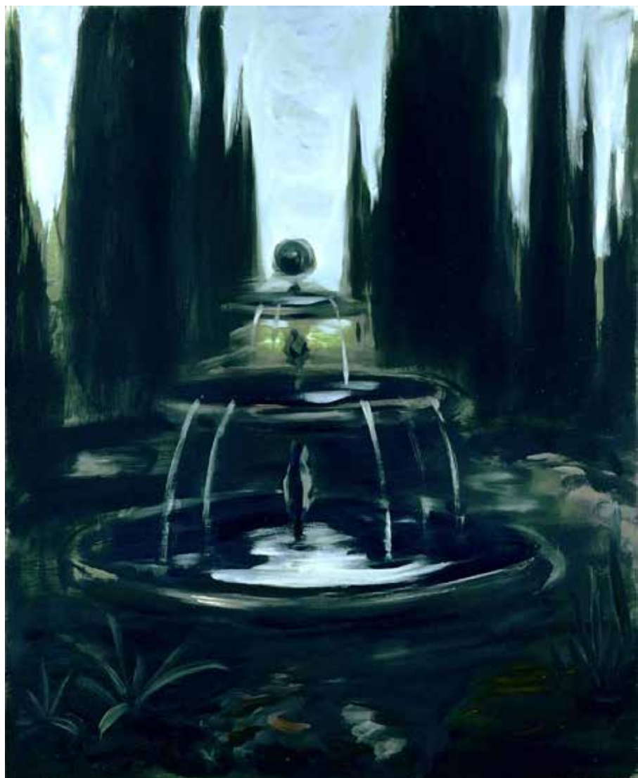
Szökőkút a ciprusok között