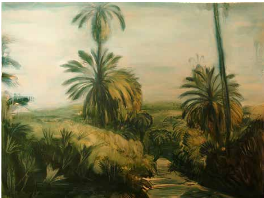
Út a dzsungelbe