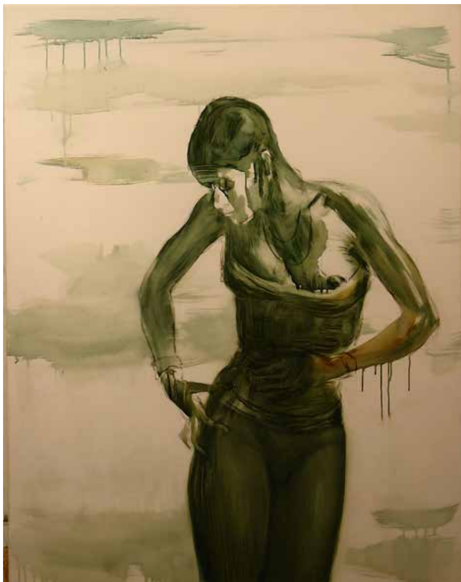
Készülődés az ünnepre