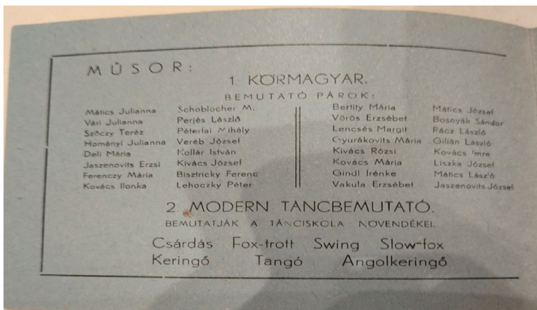
7. kép: Bánáti Béla 1946-ban meghirdetett táncanfolyama utáni bemutató előadás programja 1946-ból.