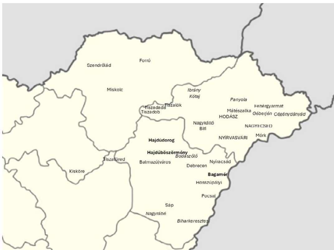
2. ábra Terepkutatási és filmforgatási helyszínek 8