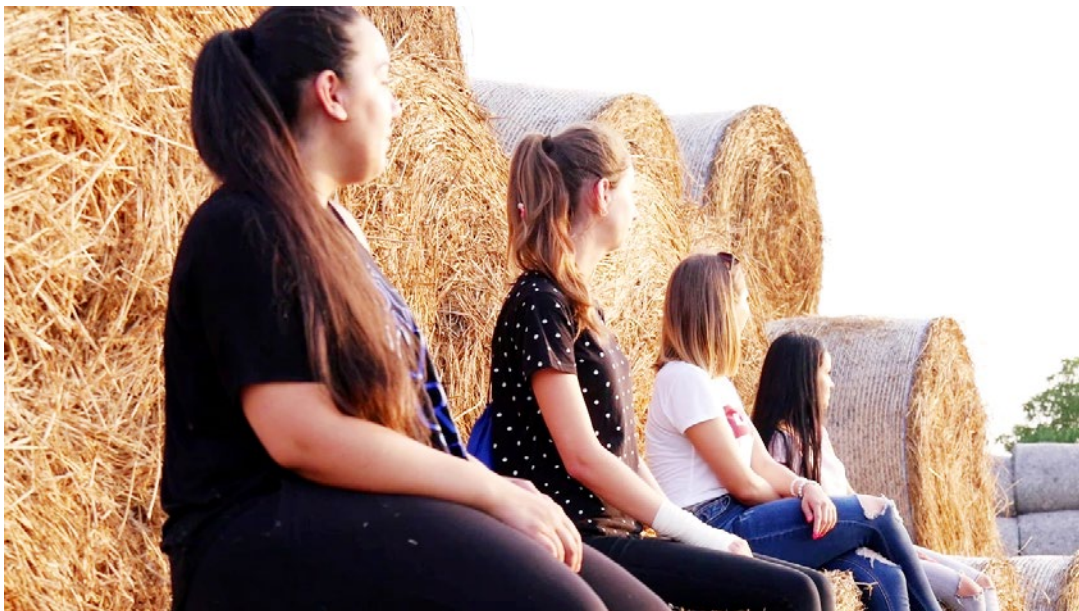
A Take a smile című dokumentumfilmből (AntRom Filmműhely, 2018)