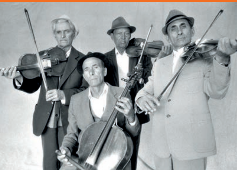
A szászfenesi zenekar.