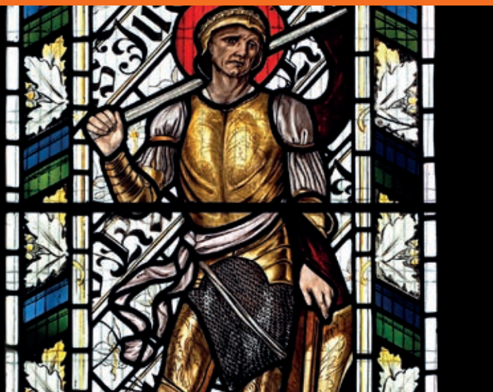
Judas Maccabeus.