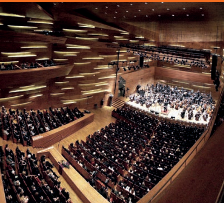
A Pannon Filharmonikusok a Kodály Központban.

A Pannon Filharmonikusok nagy figyelmet fordítanak arra, hogy közönségük a rendelkezések szigorítása, az élő koncertek korlátozása esetén is tarthassák a kapcsolatot a zenekarral, a muzsikával. Az együttes az utóbbi hónapokban még jobban ügyelt rá, hogy saját Youtube-csatornájára az érdeklődők egyetlen kattintással feliratkozhatnak, s könnyen követhessék az új zenei tartalmakat. Már több Műpában adott hangversenyük online felvételét közzétették, a feliratkozók értesítést kapnak az újabb premierekről. Megtekinthetők azok a kisfilmek is, melyeket az elmúlt hónapokban a muzsikások az otthonaikban készítettek, a zenekar korábbi hangversenyfelvételei, s az együttes működésével, munkájával kapcsolatos interjúk. A Youtube-csatorna mellett honlapjukat is érdemes böngészni, hiszen koncertvideók, zenei felvételek mellett a koncertgalériában a hangversenyeken készült fotókkal idézhető vissza az élmények, s már akadnak a nyári szabadtéri előadásokról is képes beszámoló. Találni itt kisfilmeket, image-videókat, s a legfrissebb híreket a bérlet- és jegyvásárlásról, koncertpótlásról, vagy az idei szezon részletes műsoráról.