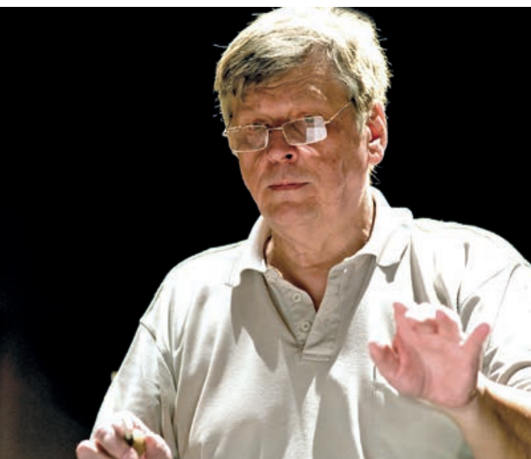
Strausz Kálmán.

Isteni pokol és Johanna a máglyán – egy ősbemutatót és egy Honegger-művet választott Strausz Kálmán jubileumi koncertjére, mellyel 70. születésnapját ünnepli. Szeptember 30-án a Zeneakadémián a Győri Filharmonikusok élén lép pódiumra, két kedves énekkarával, az általa alapított Budapesti Stúdiókórus Egyesülettel és a Honvéd Férfikarral, amelynek egy évtizeden át volt a karnagya. „Életem során temérdek kortárs művet volt alkalmam bemutatni, dirigálni, mindig érdekelt, izgattak az új művek. Így régóta gondoltam rá, hogy Tóth Pétertől is kellene már művet kérnem, mert nagyra tartom a munkásságát. Egy izgalmas Dante-történetből, Francesca és Paolo szerelméről készített szép, félórás kantátát, ami, ahogy foglalkozom vele, napról napra jobban tetszik. Örülök, hogy egy ilyen, nekem dedikált művet dirigálhatok! Honegger alkotása pedig régi szerelem. Szőnyi Erzsébet szolfézsóráin ismertem és szerettem meg. Néhány éve sikerült rábeszélnem Vidnyánszky Attilát a színpadi verzióra, s majd’ harmincszor adtuk elő a Nemzeti Színházban, hatalmas sikerrel. Nem tudok vele betelni, az eszmeisége inspirál. Örülök, hogy most több, egykori növendékemmel adjuk elő a Honegger-darabot, amit másnap Veszprémben is bemutatunk.”