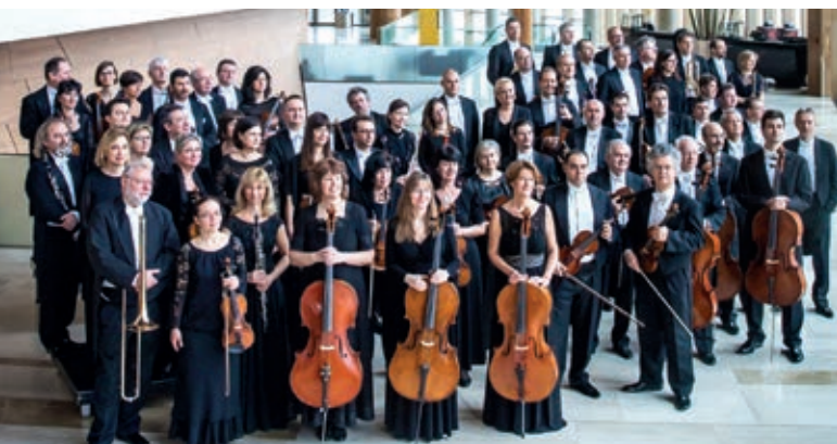
A Nemzeti Filharmonikus Zenekar.