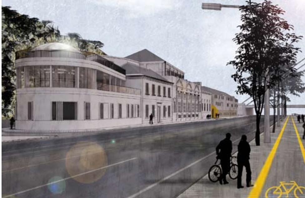
Az egykori Aranybárány fogadó és a palackozóüzem helyén wellness/étteremkomplexum létesül – Copyright: nirmana Építésziroda Kft.

koncepció kialakítására, és olyan komplexum létrehozására, amely kívül/belül kimagasló színvonalat képvisel. A tervezési terület az elhíresült Aranybárány fogadó megmaradt részét, és a palackozóüzemet foglalja magában. A tervek elkészítése a nirmana Építésziroda Kft. nevéhez fűződik (vezető tervező: Vékony Péter, munkatársak: Chvalla Diána, Kundrik Livia, Weiszhaupt Viktória, Arányi Ágnes és Hága Tamás). A nirmana nem először nyúl fürdőkhöz, hozzájuk kötődik a Hungária Fürdő rekonstrukciója is, amely számos magas szintű elismerés mellett a Média Építészeti Díját is elnyerte.