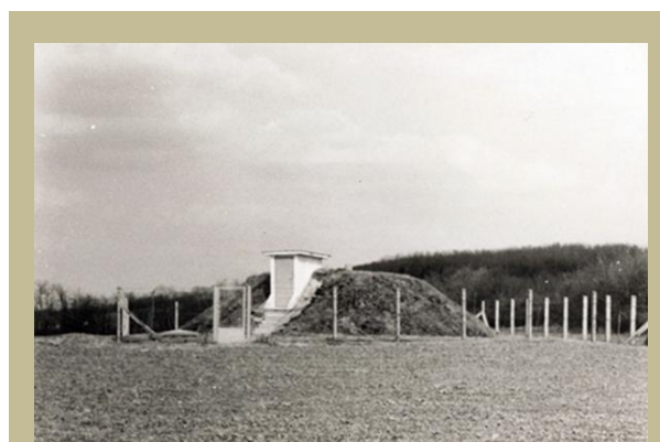
Mozsgói víztároló, 1973