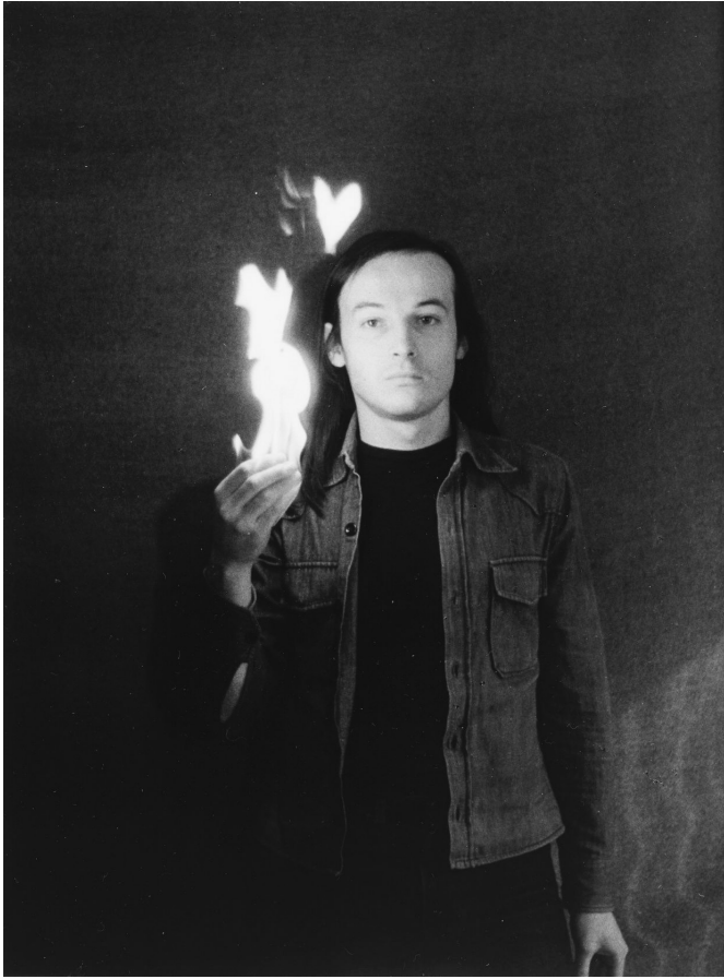
Koncz András: Ég a kezem , 1976