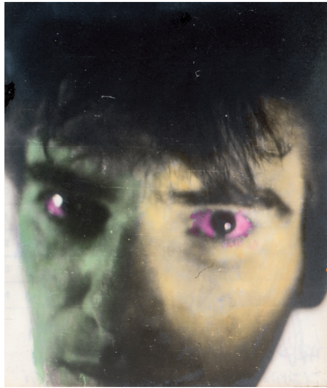
Méhes Lóránt: Önarckép , 1979