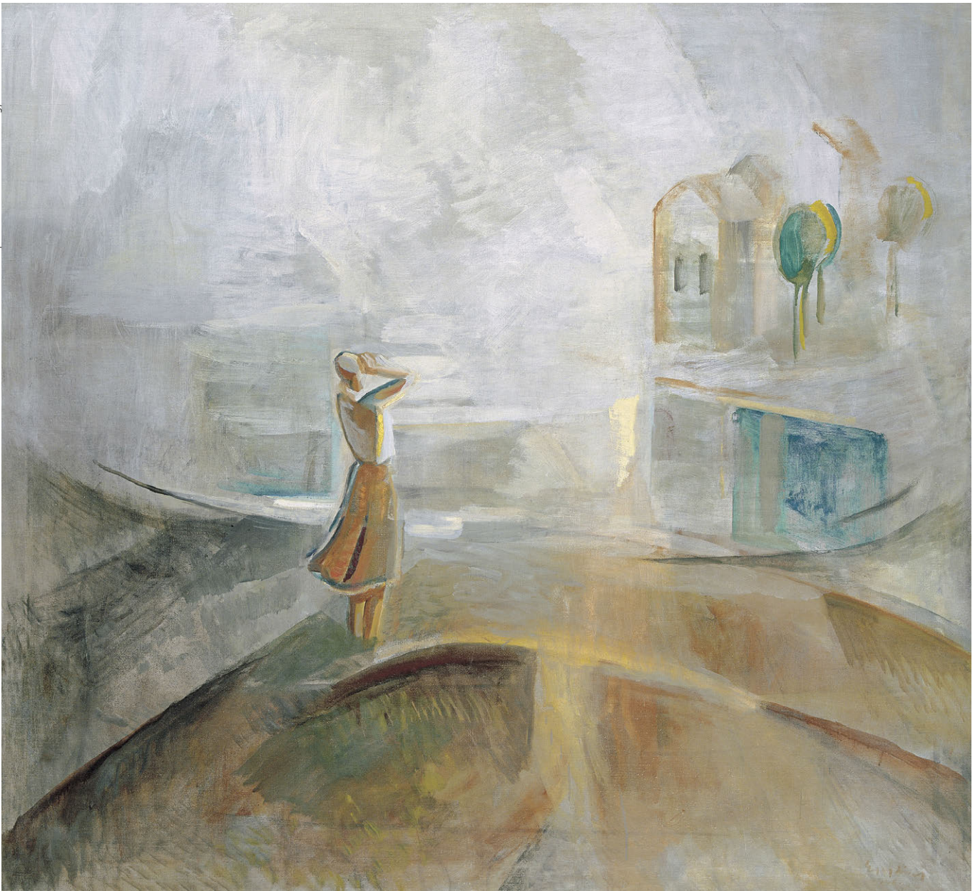
Egry József: Visszhang, 1936, olaj, vászon, 114×125 cm