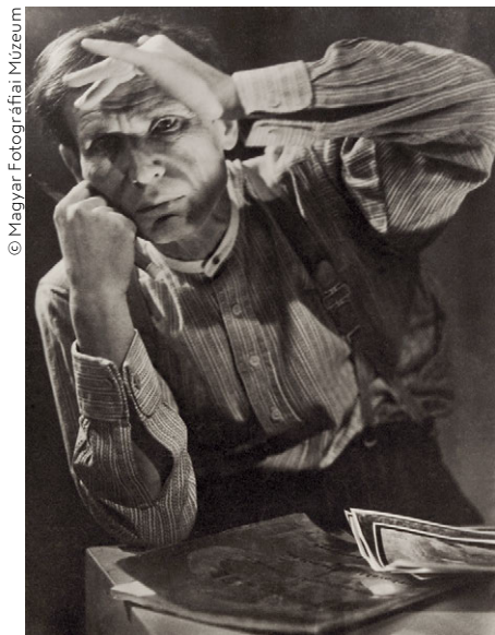
Pécsi József: Egry József portréja, 1920 Magyar Fotográfiai Múzeum

Leveleikben, visszaemlékezéseikben mindketten 1917-et adták meg házasságkötésük időpontjaként az anyakönyvben szereplő 1918 helyett, ami azt mutatja, hogy már akkor együtt éltek, amikor Pau-