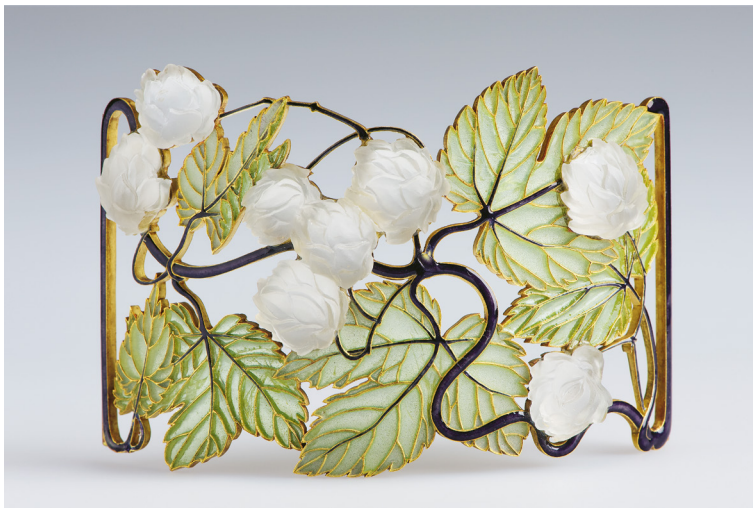
René Jules Lalique: Nyakék – Komlóinda, 1898–1900, arany, maratott üveg, technika: aszúr-zománc, öntött, rekesz-zománc, 8,3 x 5,5 x 2,1 cm,

Ékszerei második csoportjába azok tartoznak, amelyeket a francia ötvös-ékszerész, René Lalique műhelyében vagy annak hatására készíthetett 1904 után. Az ékszerek stílusában végbemenő szembevető változás és az aszúr-zománccal készült tárgyak megjelenése is ezt támasztja alá. Bár írott nyoma nem maradt annak, hogy Lalique tanítványának szegődött volna Párizsban, de a fellelhető művek egy csoportja (nem csak ékszerek) minden kétséget kizáróan a francia mester hatása alatt született. Erre közvetett bizonyítékot szolgáltat