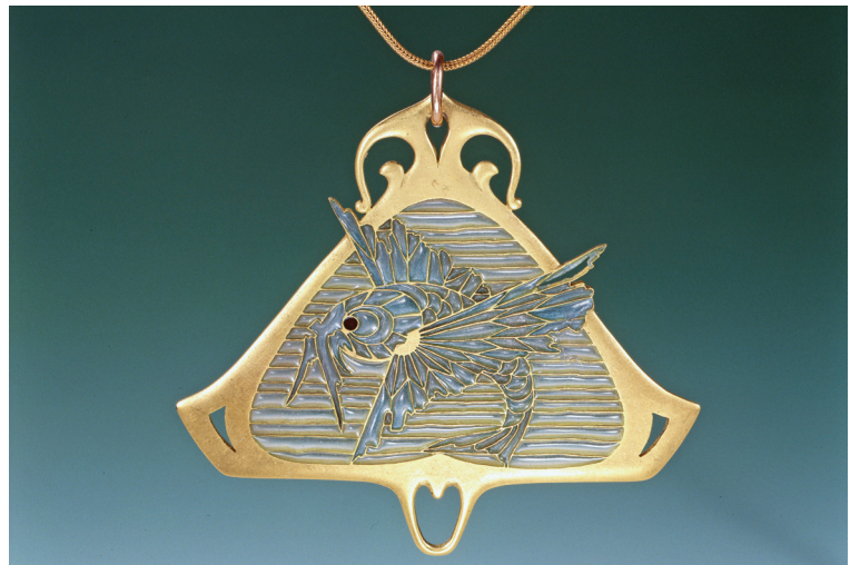
Tarján Huber Oszkár: Függő – Repülőhal, 1904 k., arany, technika: aszúr-zománc, 7 x 7,3 cm, Iparművészeti Múzeum