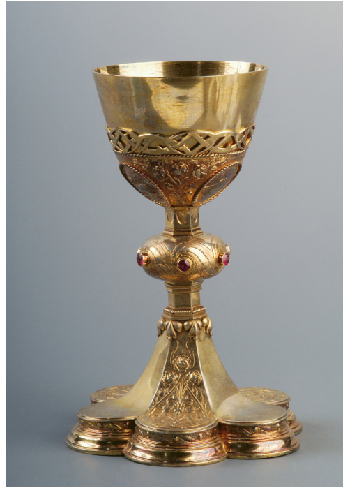
Tarján Huber Oszkár: Breyer István kelyhe, 1928, aranyozott ezüst, gránát, technika: vert, vésett, préselt, poncolt, Esztergomi Főszékesegyházi Kincstár