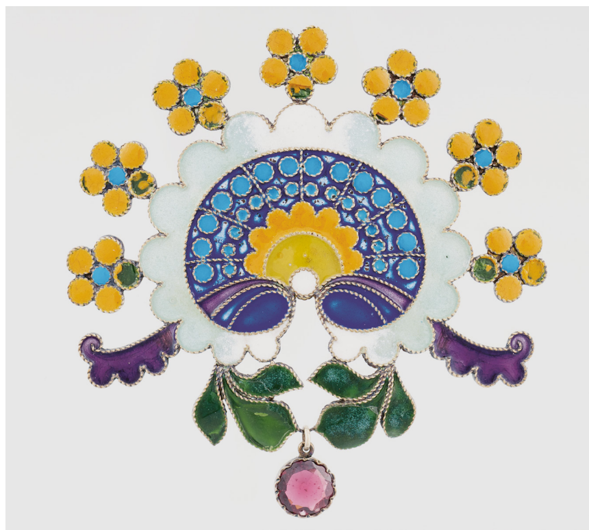
Tarján Huber Oszkár: Függő, 1900 k., almandin, aranyozott ezüst, technika: filigránzománc, 6,5 x 6,5 cm, Iparművészeti Múzeum

a kritika. 5 A kereskedelemügyi miniszter által alapított állami érmet is „új formájú zománc-ékszereinek művészi ízléssel s olcsó árak mellett való készítéséért” ítélték neki. Az 1901-es kiállítás anyagából Ferenc Józsefnek is vásároltak Tarján Hubertől az egy évvel korábban rendelt két oxidált vörösréz csésze mellé egy zománczott tányért, és az Iparművészeti Múzeum gyűjteménye is gyarapodott két zománcos násfával, melyeket a vallás- és közoktatásügyi miniszter az országos képzőművészeti tanács segítségével választott ki. A nemzetközi siker sem váratt sokáig magára, 1902-ben Torinóban szerepelt ötvösremekeivel a magyar pavilonban. A megnyitón a magyar delegáció kiemelt tagjaként személyesen is bemutatták az olasz királyi párnak, a szaklapok pedig beszámoltak a magyar ötvös ékszereinek hihetetlen népszerűségéről: a híres amerikai ékszerész, Tiffany már a nyitónapon megvásárolt nyolcat közülük, de a francia ötvösmester, „Lalique és más híres ízlésű urak is siettek néhány darabot lefoglalni” 6 . Tarján Huber Oszkár a torinói kiállításról aranyéremmel tért haza. 1904-ben a Saint Louis-i, 1906 nyarán pedig a magyar csoport számára tragikusan