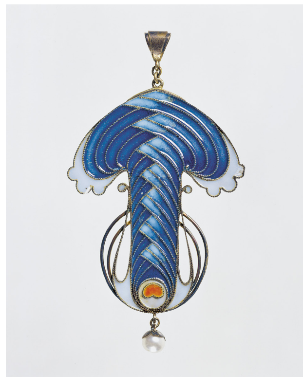
Tarján Huber Oszkár: Függő, 1900 k., aranyozott ezüst, gyöngyutánc, technika: sodronyzománc, 9 x 5,2 cm, Iparművészeti Múzeum