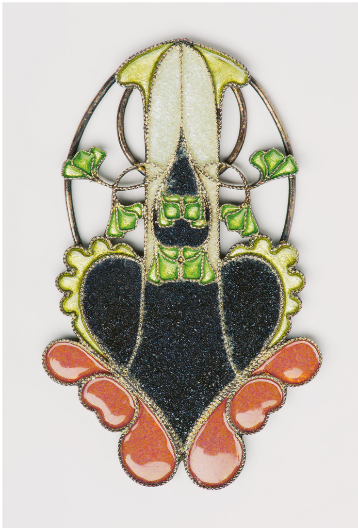
Tarján Huber Oszkár: Függő, 1900 k., ezüst, technika: sodronyzománc, 5,3 x 3,3 cm, Iparművészeti Múzeum