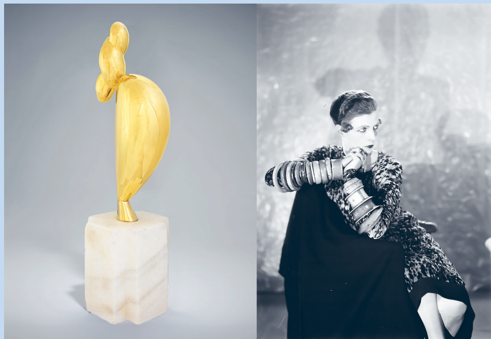
Balra Constantin Brancuși: Kifinomult fiatal lány / La jeune fille sophistiquée (Nancy Cunard portréja), 1928 (bronzba öntve 1932-ben), egyedi alkotás, Christie's New York, Impressionist and Modern Art Evening Sale, 2018. május 15.