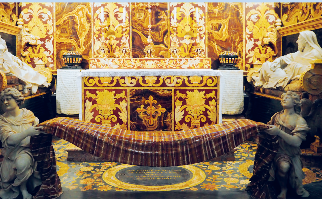
Balra a Cappella Spada Rómában, a San Girolamo della Carità templomban, lent a kápolna Uroboroszt mintázó padlóintarziája