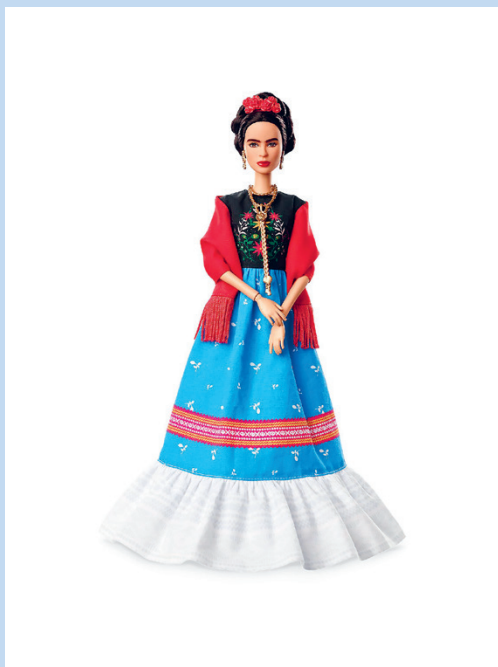
Frida Kahlo Doll – a festőnőről mintázott új Barbie baba