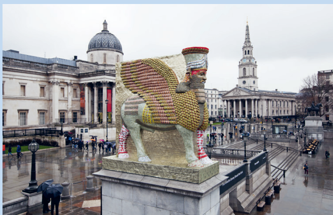
Michael Rakowitz: A láthatatlan ellenség nem létezik ( The Invisible Enemy Should Not Exist ) a Trafalgar téren

A kápolna egyébként nyugodtan szerepelhetne a titkos Rómát bemutató útikönyvekben (talán szerepel is némelyikben), mert padozatán az egyik fő szabadkőműves-alkimista szimbólum, az Uroborosz, a saját farkába harapó kígyó látható. Feltételezhetjük tehát, hogy Borromini és Virgilio Spada együttműködése nemcsak gyakorlatilag, építőként, hanem magasabb szinten, szabadkőműves testvérként is megvalósult. (T. T.)