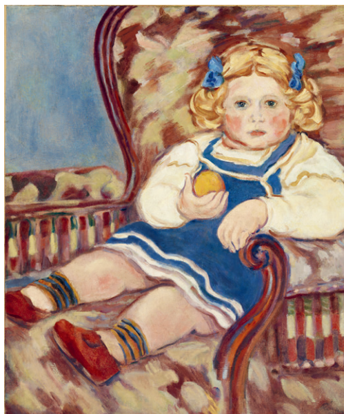
Rippl-Rónai József: A Kunffy-gyerek, 1904, olaj, vászon, 70,5 x 59 cm