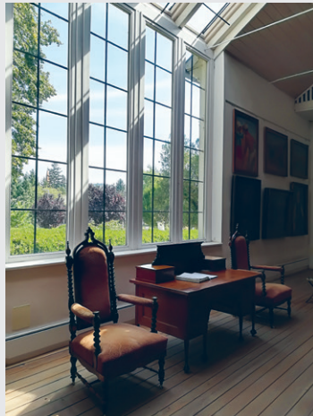
A somogytúri Kunffy-kúria (ma emlékmúzeum) az északi tájolású műteremházzal