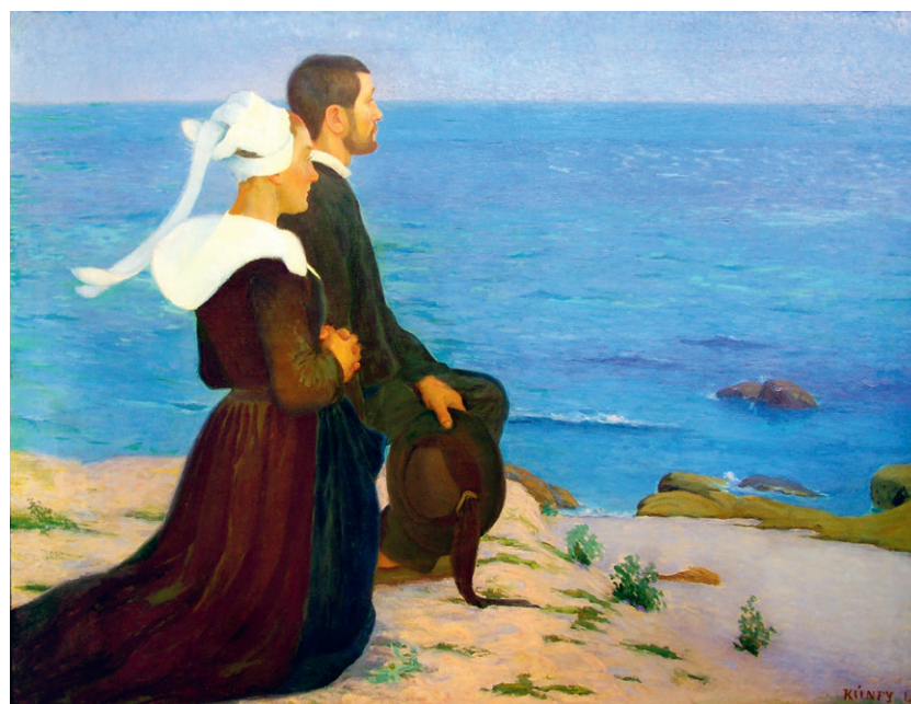
Kunffy Lajos: Breton pár a tengerparton , 1889, olaj, vászon, 126,5 x 173 cm, Rippl-Rónai Múzeum