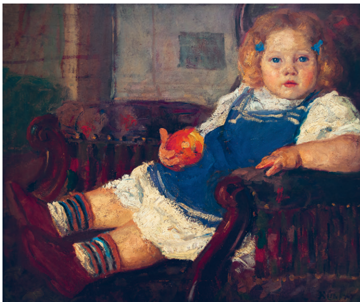
Kunffy Lajos: Fiam almával , 1904, olaj, vászon, 46 x 55 cm, Rippl-Rónai Múzeum