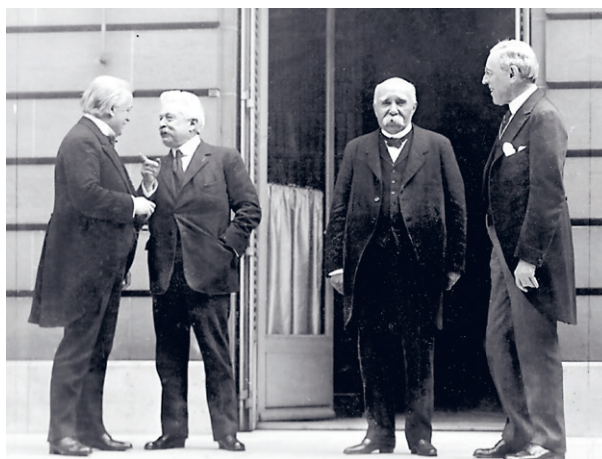
A Négyek tanácsa az első világháborús párizsi békekonferencián, 1919. május 27-én, balról jobbra: David Lloyd George (Nagy-Britannia miniszterelnöke), Vittorio Orlando (Olaszország miniszterelnöke), Georges Clemenceau (Franciaország miniszterelnöke), Woodrow Wilson (az Egyesült Államok elnöke)