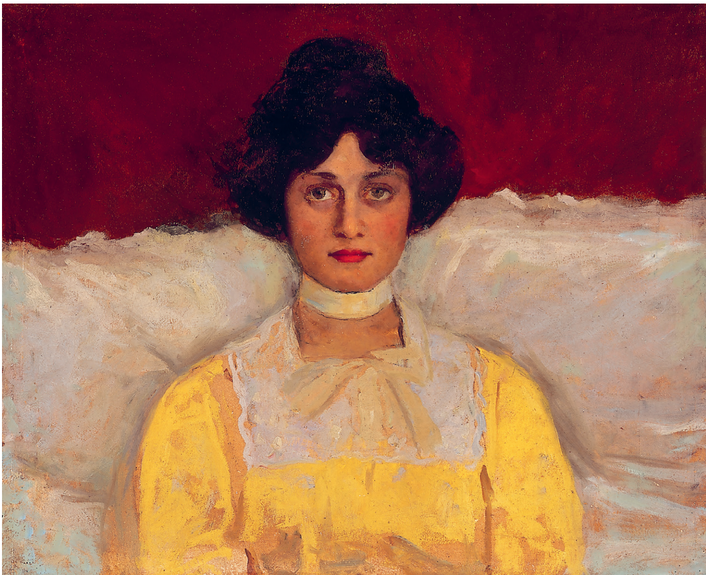
Kunffy Lajos: Sárga blúzós hölgy (Kunffyné képmása) , olaj, karton, 59,5 x 73 cm, a Kieselbach Galéria és Aukciósház jóvoltából