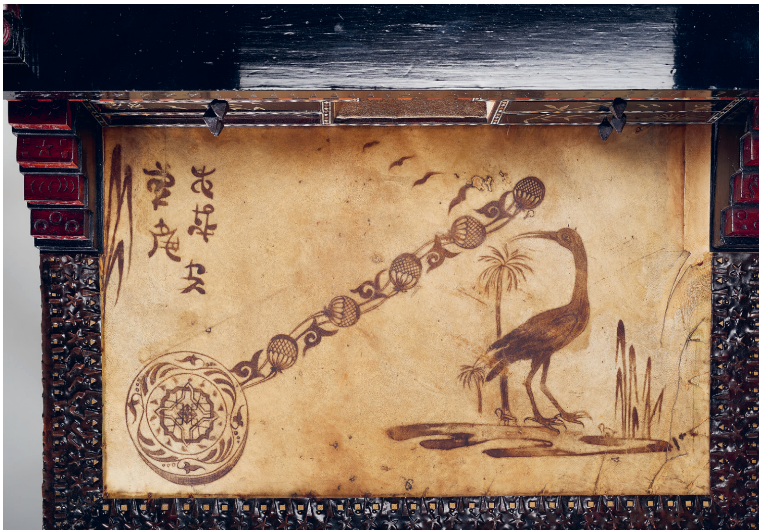
Az asztalka keleties díszítésű, pergamennel borított írófelülete