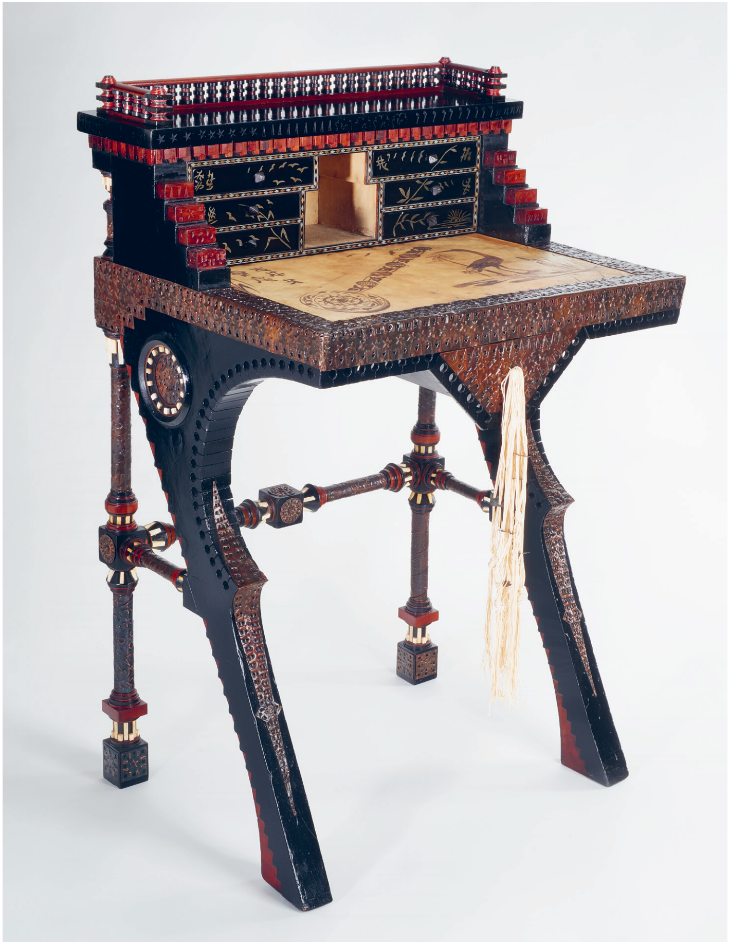
Női íróasztal (konzolasztal) Carlo Bugatti műhelyéből, 1900 körül, fa, pergamen, csont és domborított fémlémez díszítménnyel (selyemrojjtal), magasság: 100 cm, mélység: 48 cm, szélesség 58 cm, Iparművészeti Múzeum, Bútorgyűjtemény, ltsz.: 62.500.1