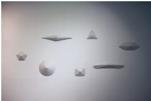
Részlet Káldi Katalin kiállításából az alábbi munkákkal: Pont , 2018, 40 x 50 x 8,5 cm; Hő , 2018; Ötszög , 2018, 49 x 49 x 12 cm; Hatszög , 2018, 39 x 112 x 16 cm; Laposabb Ötszög , 2018, 153 x 24 x 12 cm; Pajzs , 2018, 80 x 80 x 17 cm; Kettős kúp , 2018, 139 x 30 x 16 cm