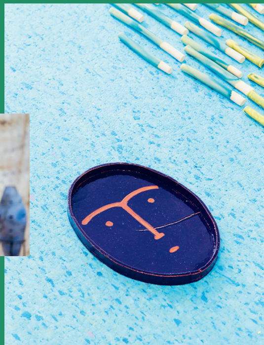
Részlet a Por meg pára című kiállításon szereplő, Szemző Zsófiával közösen készített installációból, ami a Labor Galériában volt látható 2017 májusában