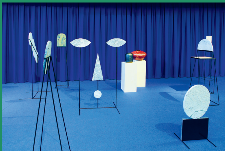
Enteriőrfotó a Since our stories all sound alike című egyéni kiállításáról, ami a milánói Galleria Compariban volt látható 2018-ban