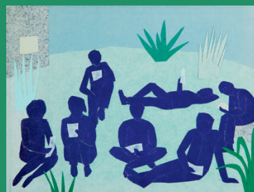
Ember Sári: Egy portrékíséret No. 1 , 2014, papírkollázs, 16 x 21 cm