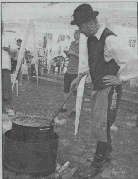
5. kép. Birkafőző verseny – Karcag, 2012