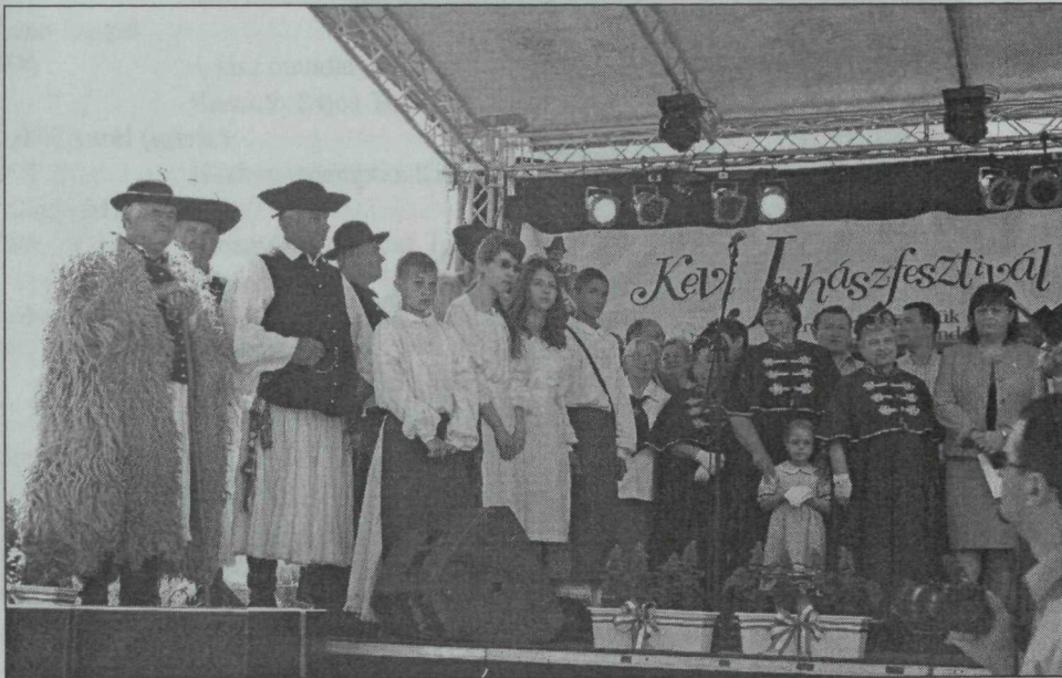
3. kép. Kevi juhászfesztivál, – Túrkeve, 2012