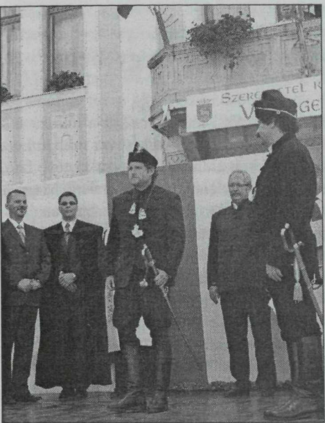
4. kép. Nagykun kapitány választás – Karcag, 2012