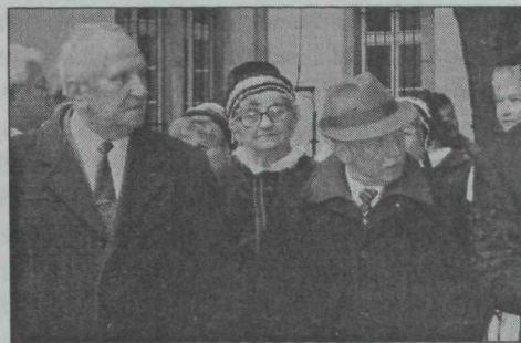
6. kép. Kisújszállási hagyományörzők albuma (részlet)