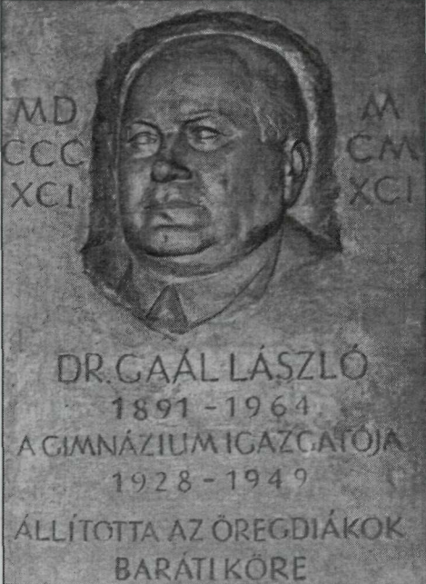
5. kép. Somogyi Árpád: Gaál László emléktáblája a Karcagi Nagykun Református Gimnázium, Egészségügyi Szakközépiskola és Kollégium főépületében