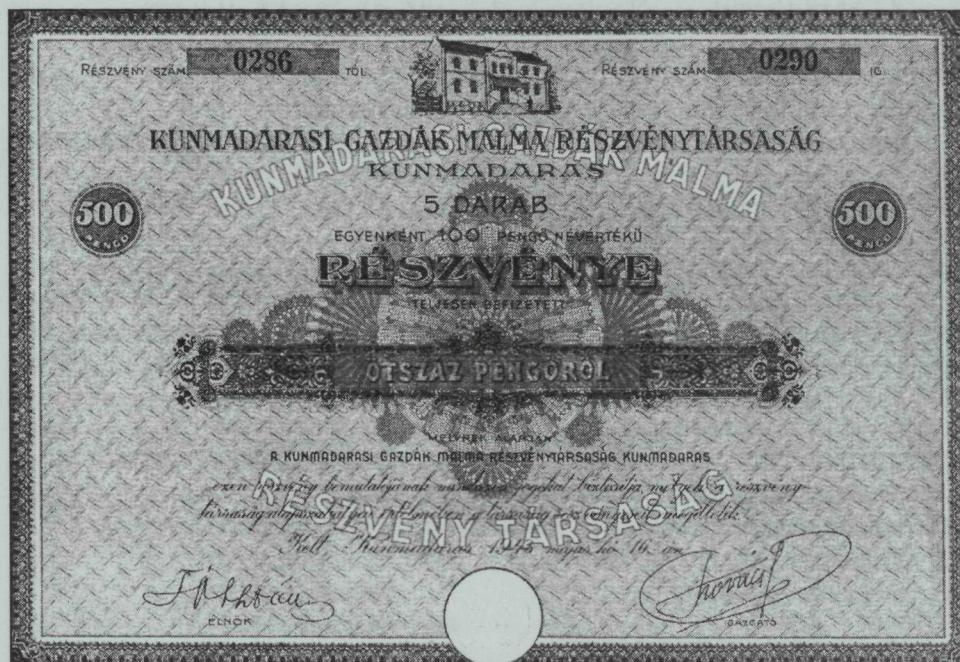
10. melléklet. Kunmadarasi Gazdák Malma Rt. részvénye, 1943

elvitték osztán. Innen Dévaványára mentek, Dévaványán vót valami gyűjtőhely, és ott Dévaványán az öreg asszon meghalt. És ott temették el. Ez az előzménye ennek. Ennek meg nagy híre lett. Minden. Ezt a kutat azír nevezték el Hajzer-kútnak.” (18.)