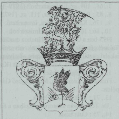
1. melléklet. Kunmadaras régi címerei – 1716. és 19. század